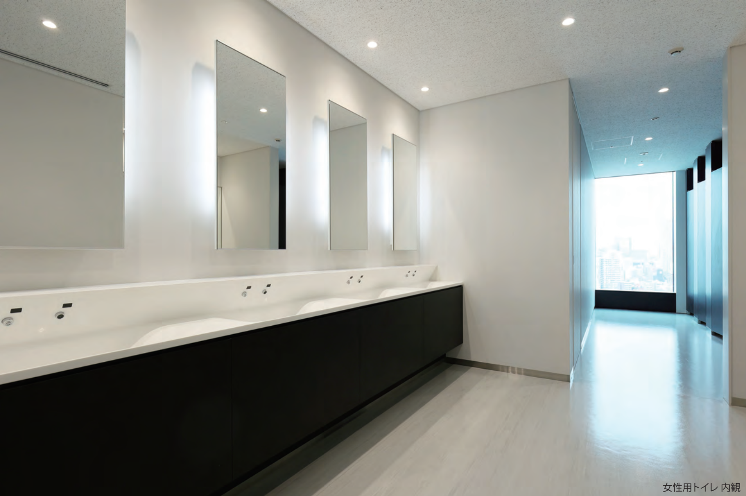
女性用トイレ 内観