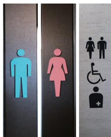
男性用 トイレサイン 女性用 トイレサイン 多機能 トイレサイン

多機能トイレは男性用トイレ側と女性用トイレ側の2箇所に入り口を設置。廊下に面していないので、トイレへの出入りが目立たないようにしている。