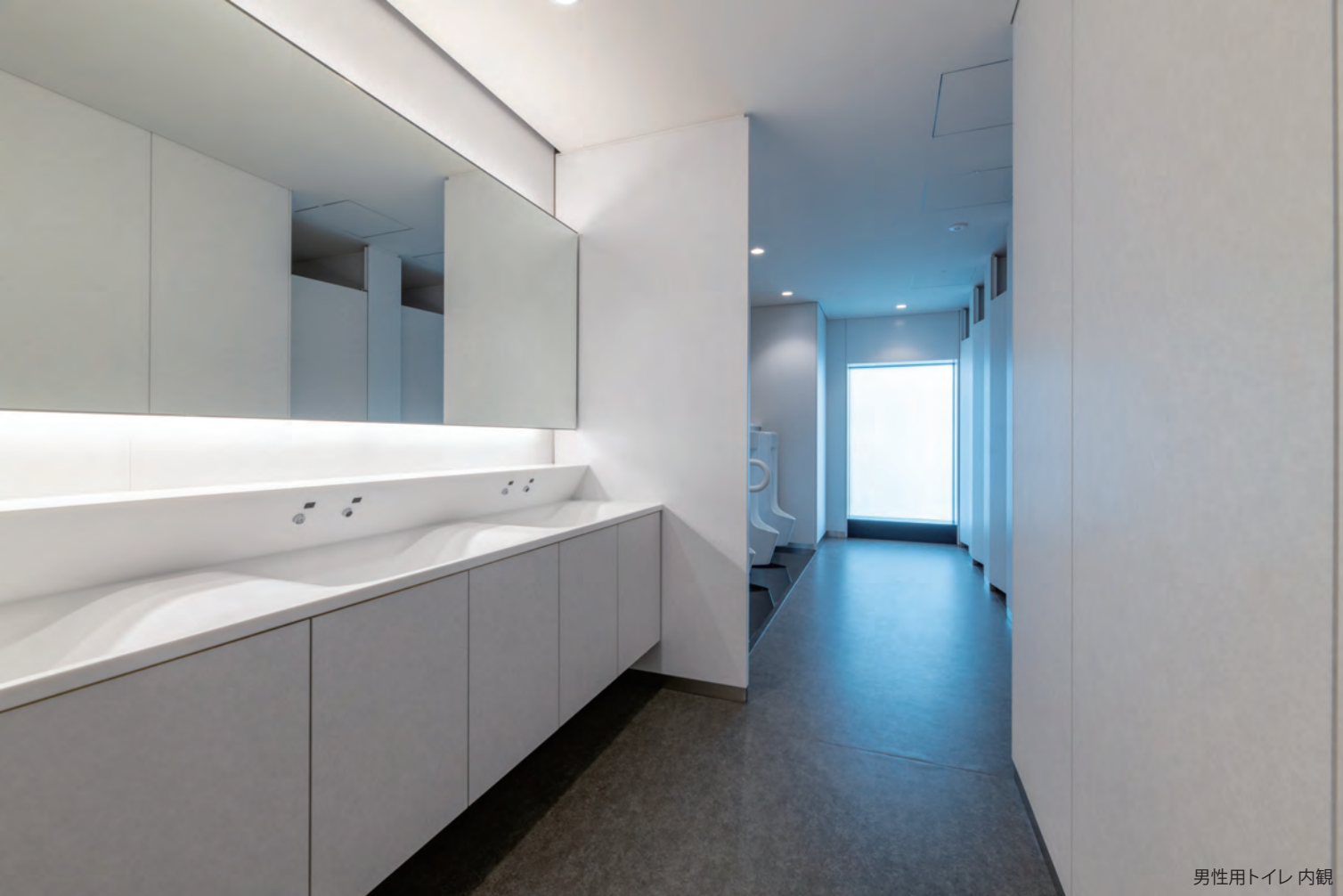
男性用トイレ 内観