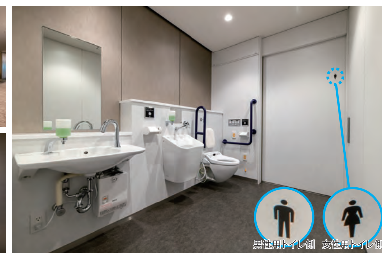
男性用トイレ側 女性用トイレ側

オストメイトの方に配慮した流しも備えたゆとりある多機能トイレ。ドア上部にトイレサインを表示し、入ってきたドアがわかりやすくなっている。