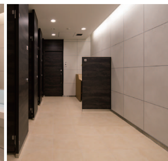
女子トイレ：壁・床