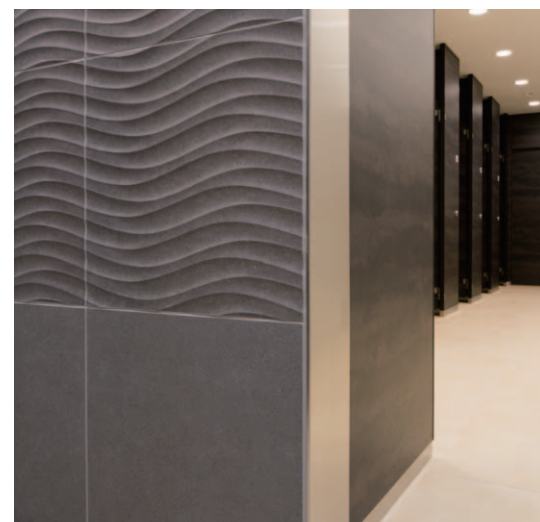
女子トイレ入口：壁・床