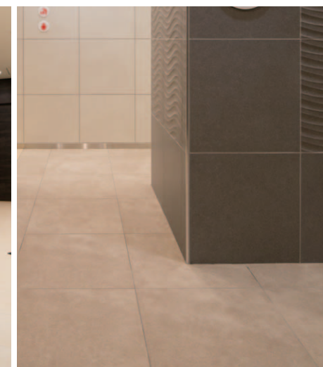
女子トイレ：壁・床