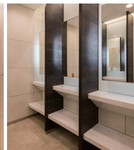
女子トイレパウダーコーナー：壁・床