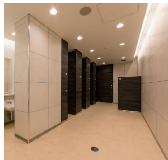
女子トイレ：壁・床