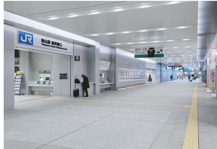
新幹線口コンコース