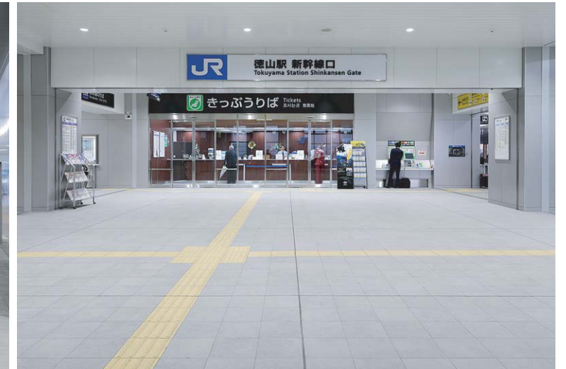
新幹線口コンコース