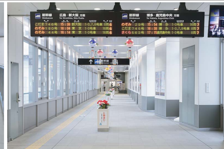
在来線改札内通路(新幹線改札方面)