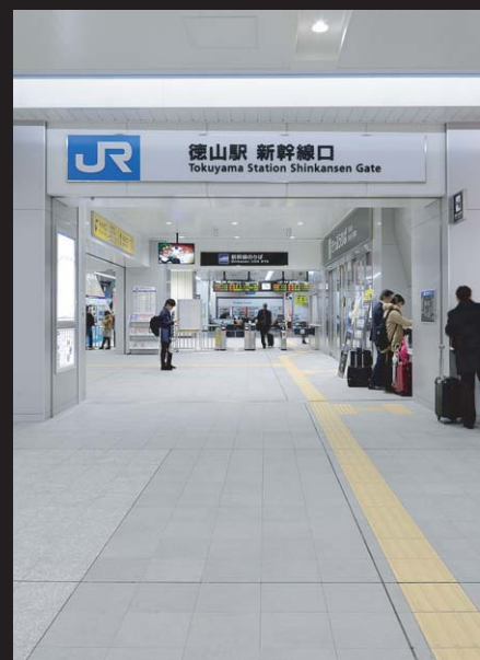
新幹線口コンコース