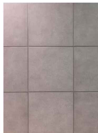
内装床面タイルディテール