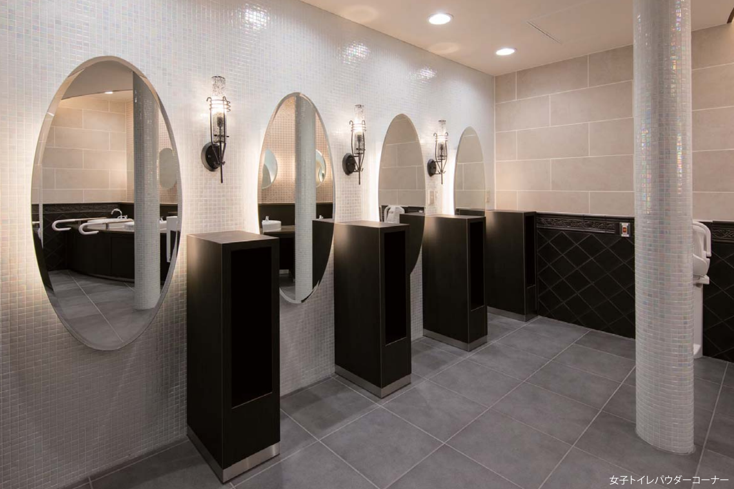
女子トイレパウダーコーナー