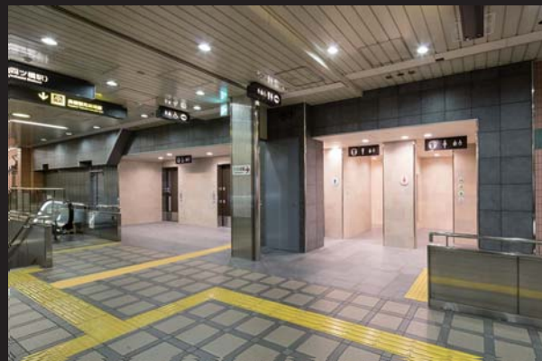
トイレ入口：壁・床

デザインは、「夕日と心齋橋」のテーマとなっており、御堂筋線と長堀鶴見緑地線の乗換え通路には、長堀川に架かっていた当時のレトロな心齋橋を再現されていることから、「レトロな喫茶店」をコンセプトとし、落ち着きのある空間を演出。トイレ入口から内部までふんだんにタイルが採用されている。