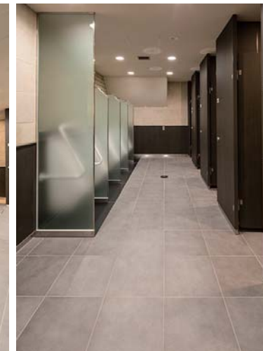
男子トイレ：壁・床