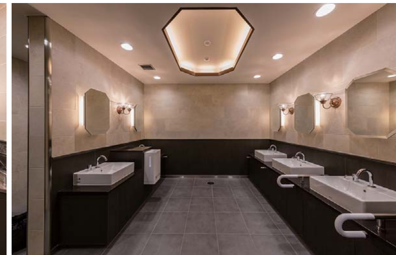
男子トイレ洗面コーナー：壁・床