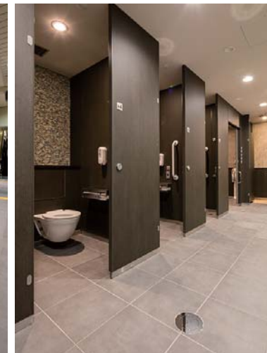
男子トイレ：壁・床