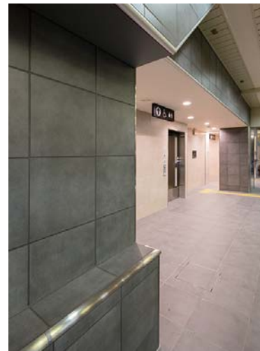
多機能トイレ入口：床