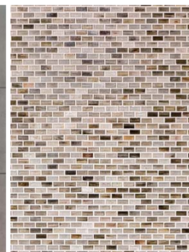
内装壁面ガラスモザイクディテール