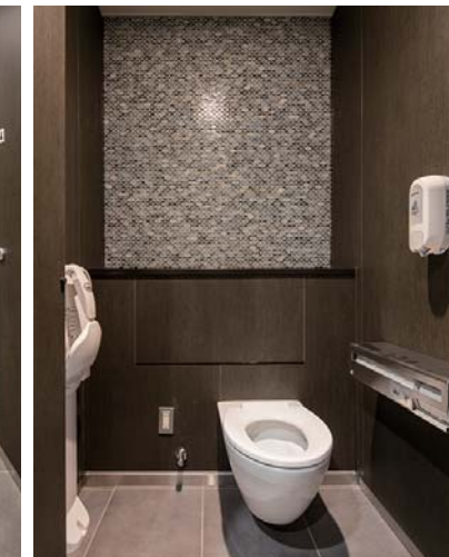
男子トイレブース：壁・床