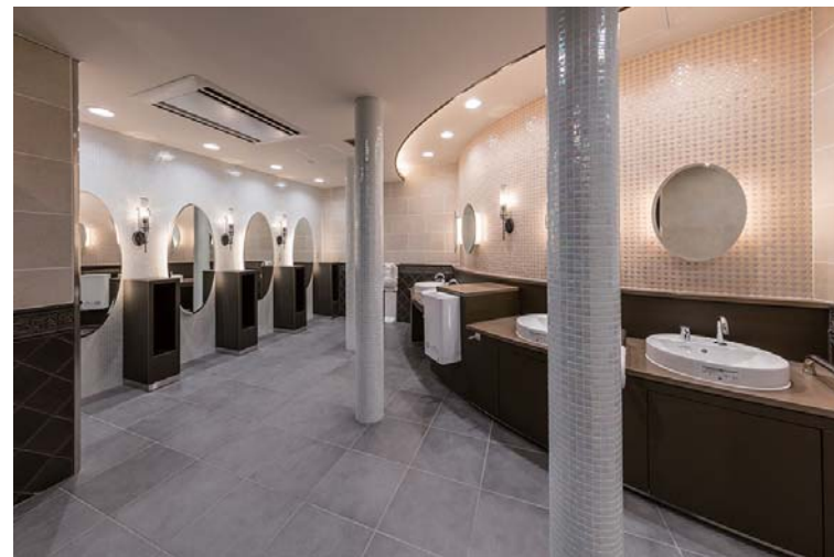
女子トイレ洗面・パウダーコーナー：壁・床