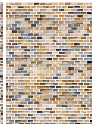
内装壁面ガラスモザイクディテール