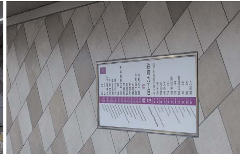
ホーム階軌道対向壁近景