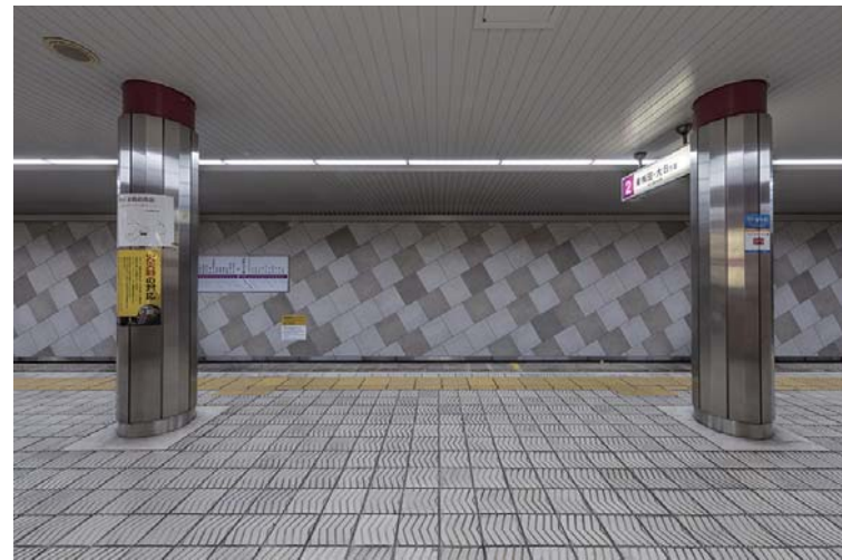
ホーム階軌道対向壁正面全景