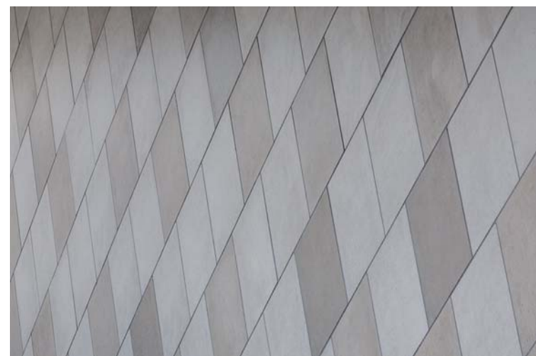
内装壁面タイルディテール