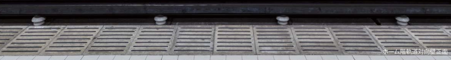
ホーム階軌道対向壁正面

転落時はホーム下へ Do not fall onto the platform if you fall Please get down to the ground level If you are on the platform, please do not stand on the edge of the platform, especially in the case of an emergency. Please do not stand on the edge of the platform, especially in the case of an emergency. Please do not stand on the edge of the platform, especially in the case of an emergency.