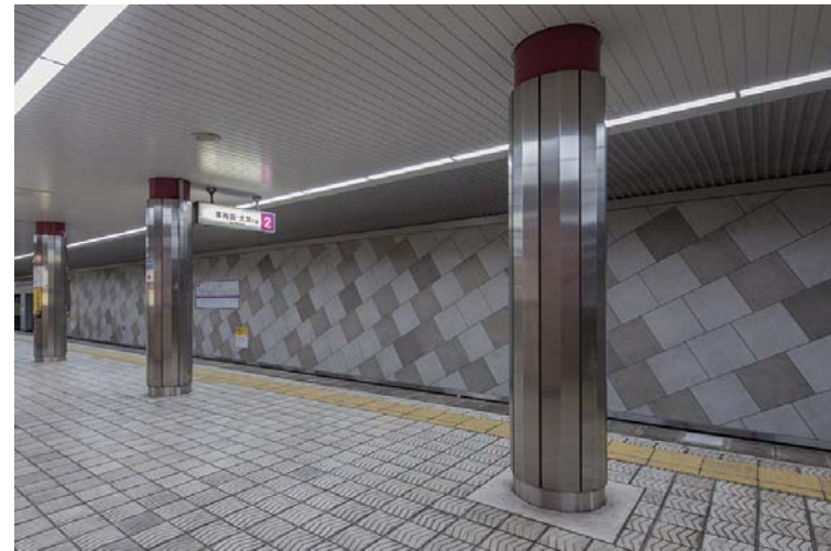
ホーム階軌道対向壁やや斜め面全景