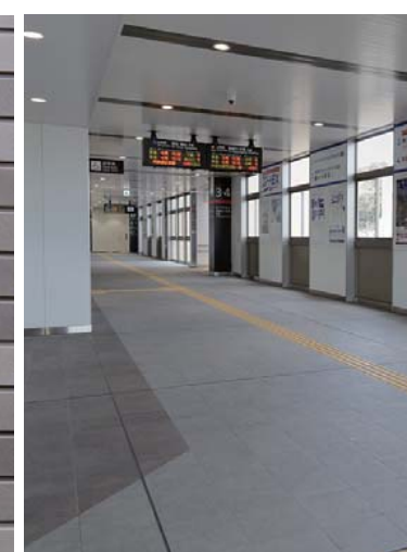
外装床面タイルディテール