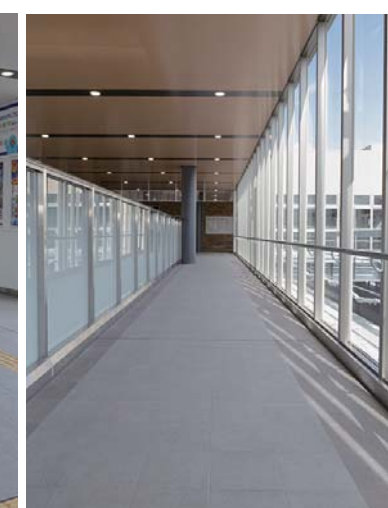
外装床面タイルディテール