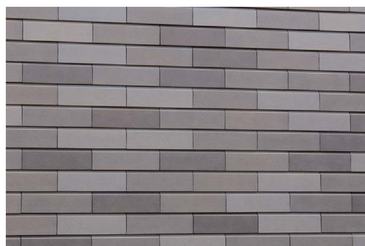
外装壁面タイルディテール