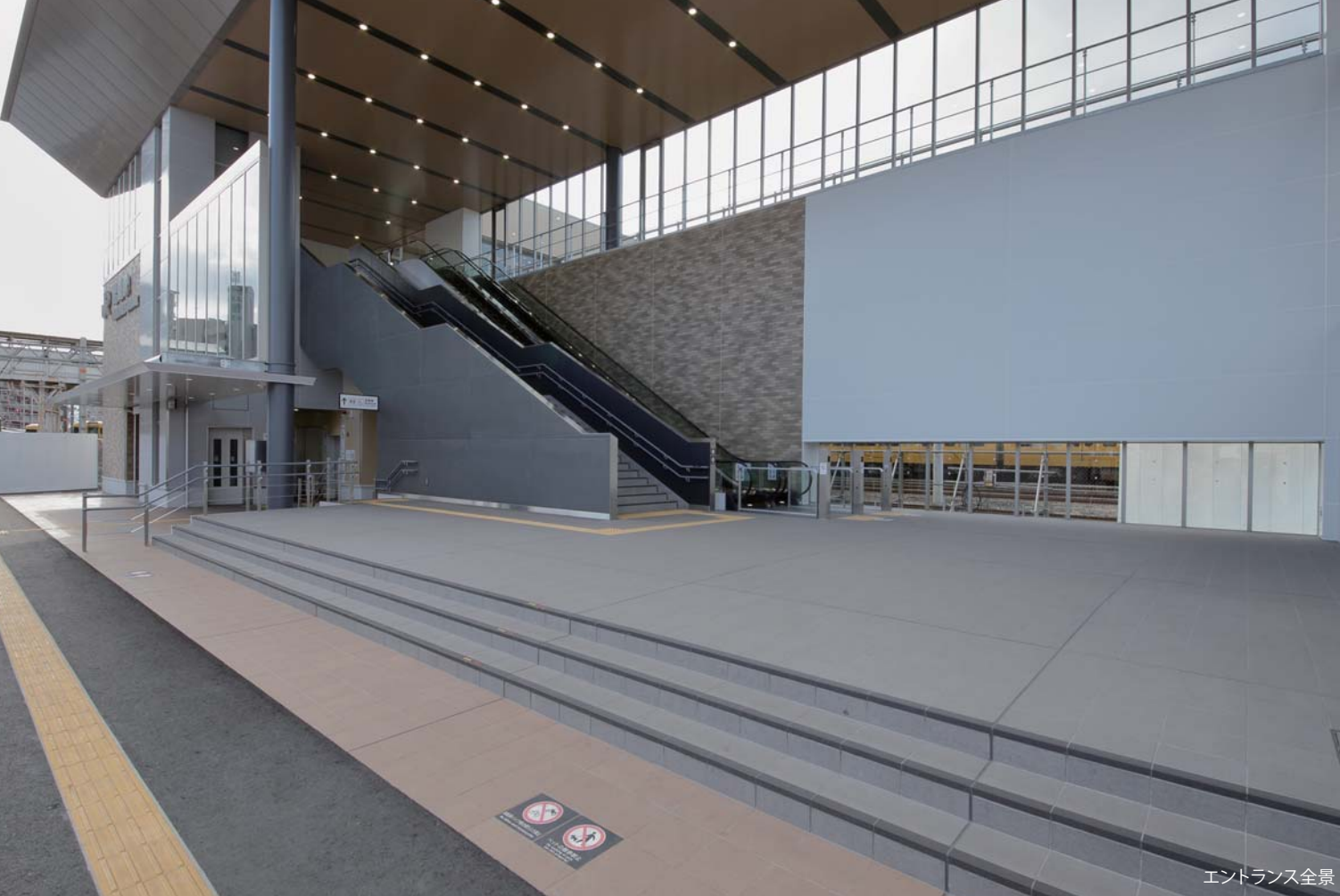
エントランス全景