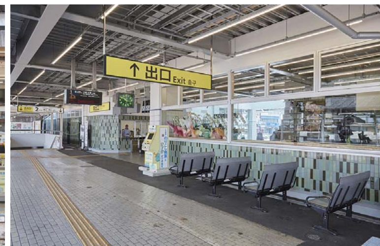
ベンチまわり内壁