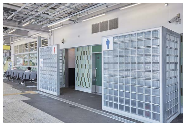
トイレ入口まわり壁面