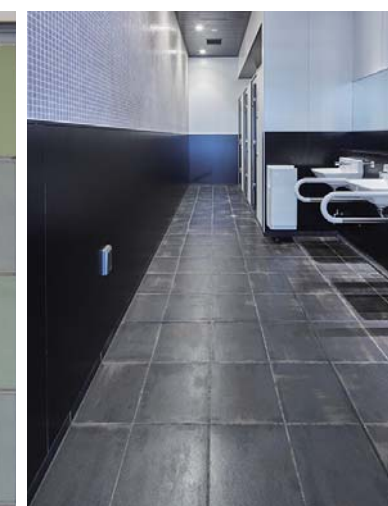
男子トイレ床まわり