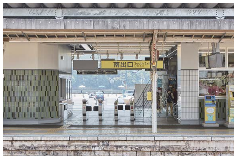
改札まわり正面内壁