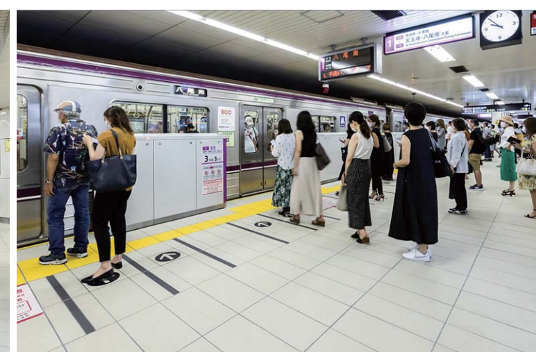
ホーム階床面中景