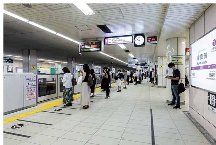
ホーム階床面全景