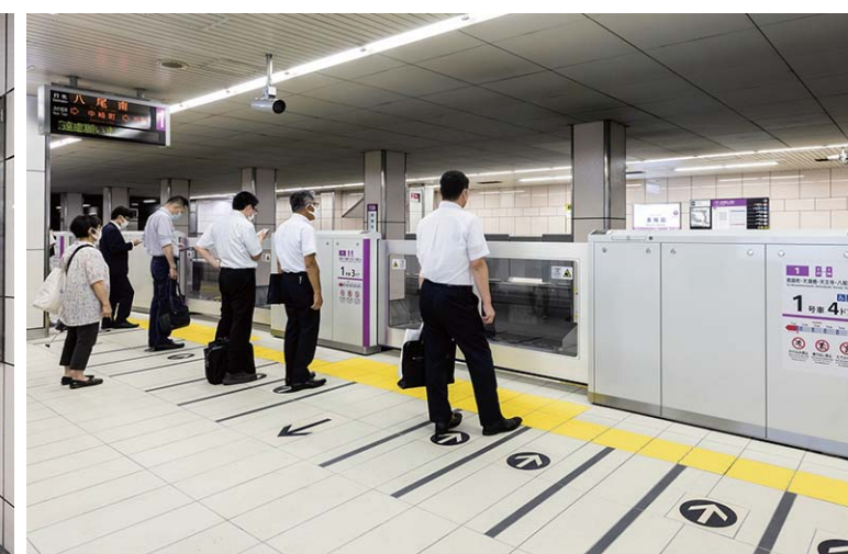
ホーム階床面中景