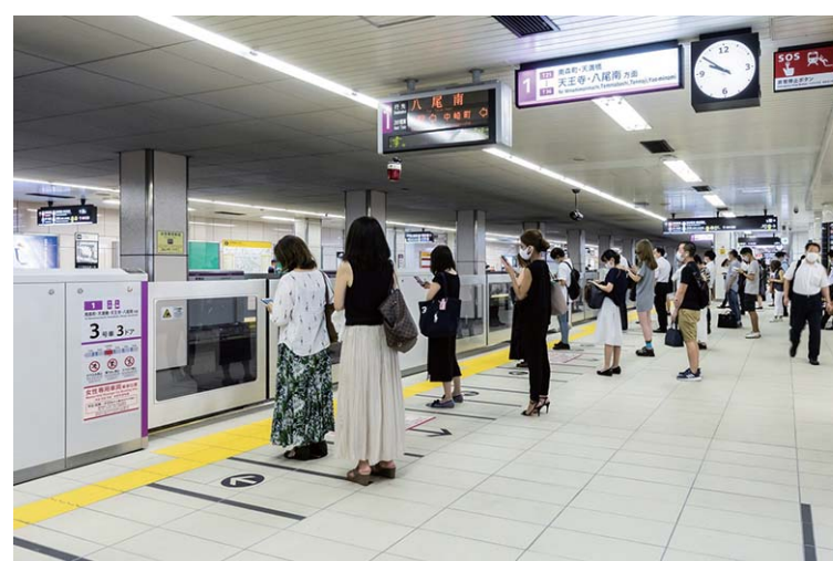
ホーム階床面中景