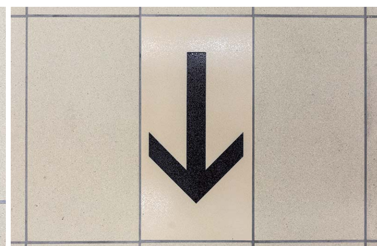
内装床面タイルディテール