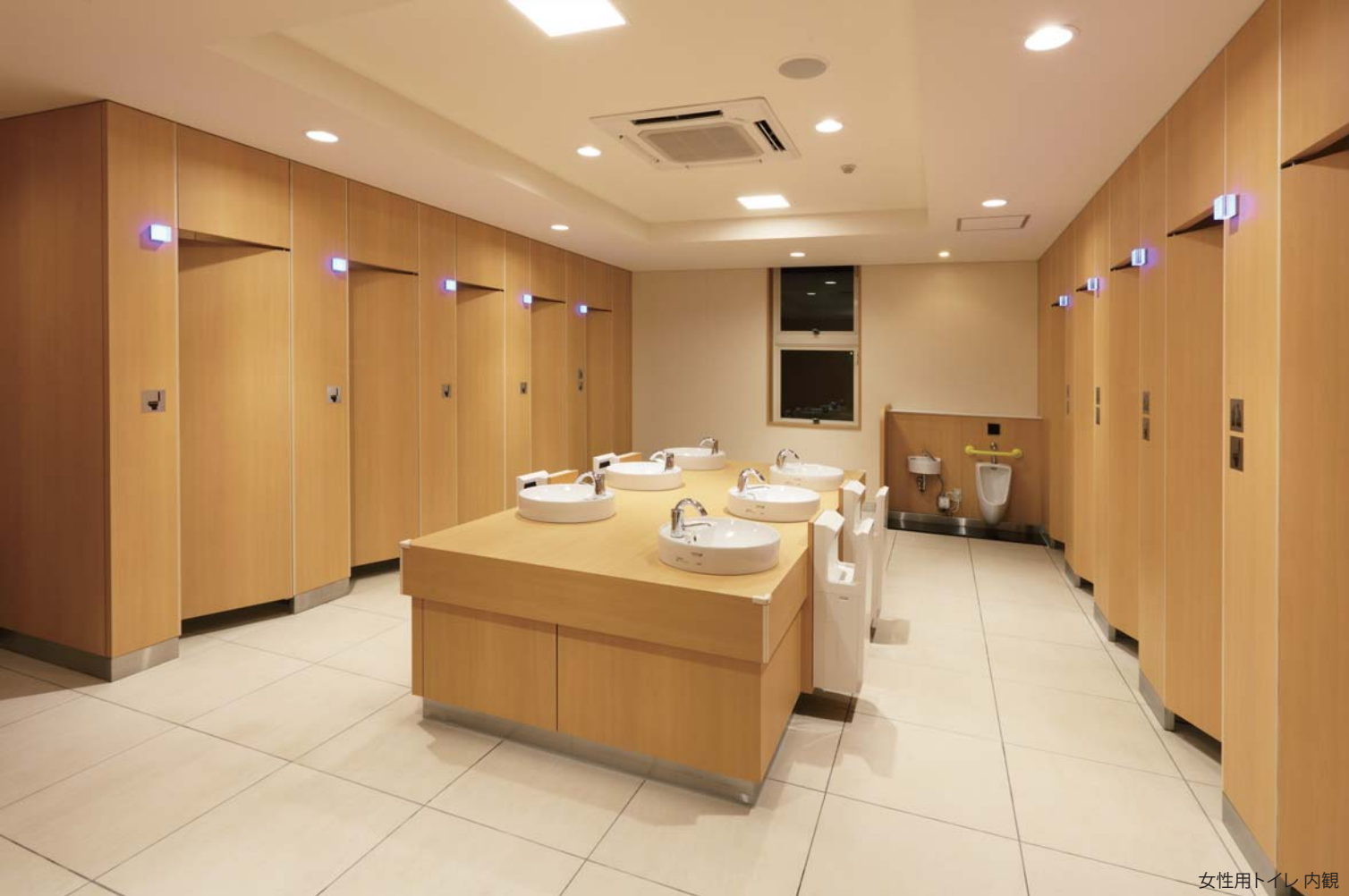
女性用トイレ内観