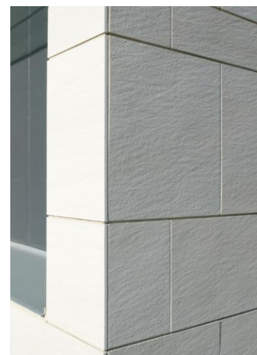
タイルディテール