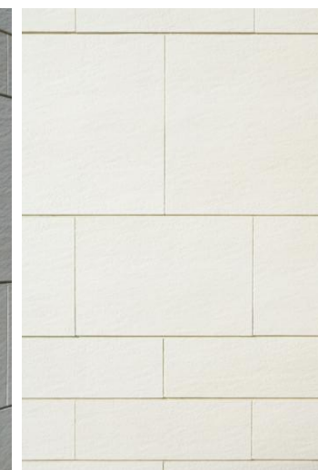
タイルディテール