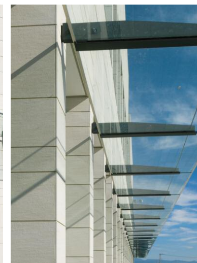
タイルディテール(開口部)