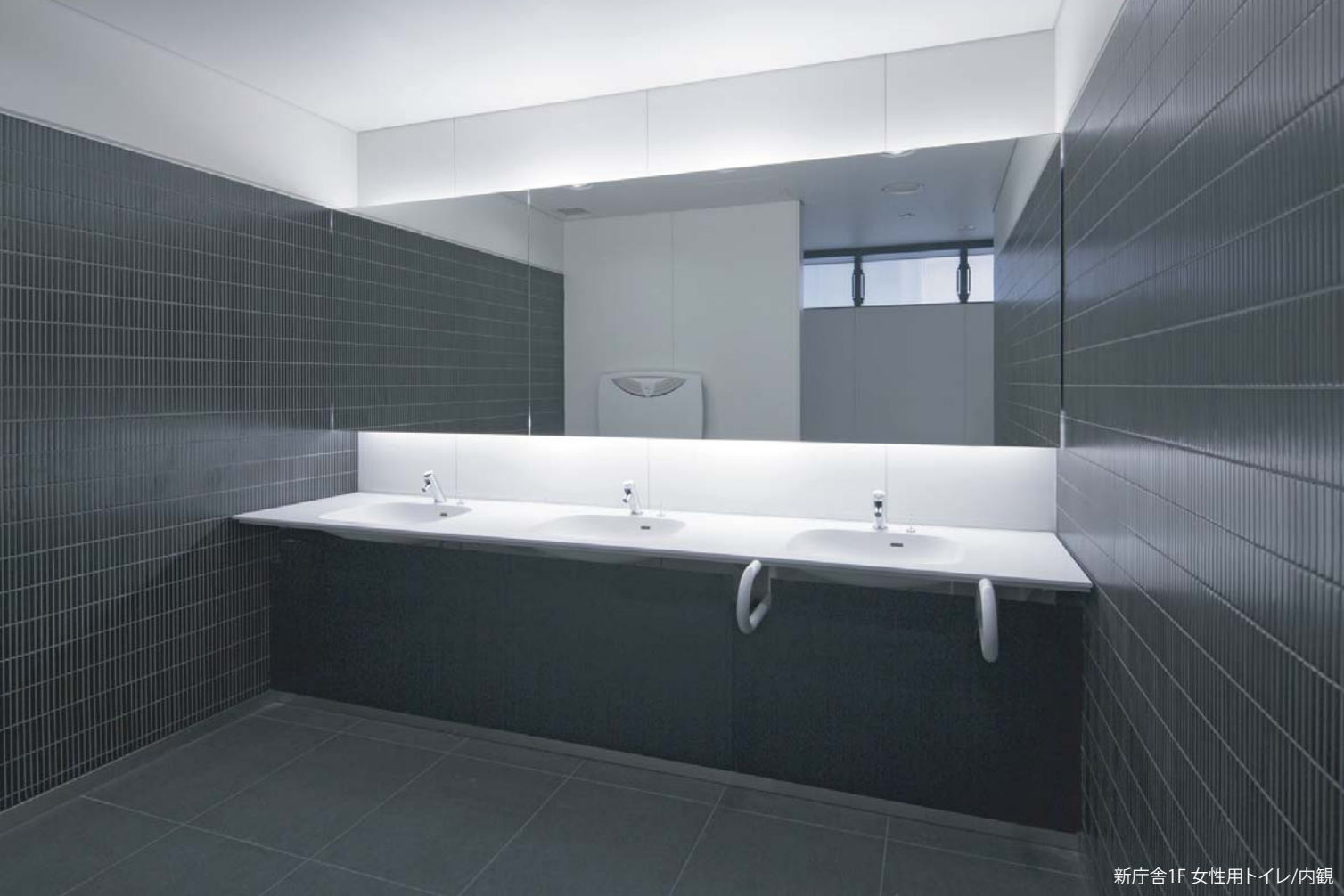
新庁舎1F 女性用トイレ/内観