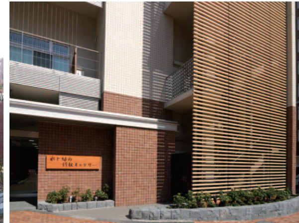
西側/ギャラリー入口