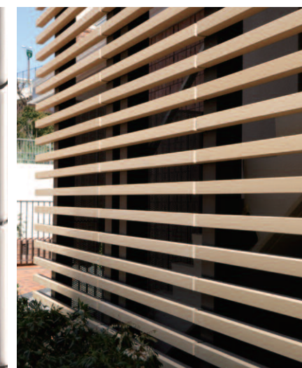
テラコッタルーバーディテール