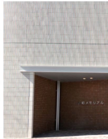
東側/エントランス入口