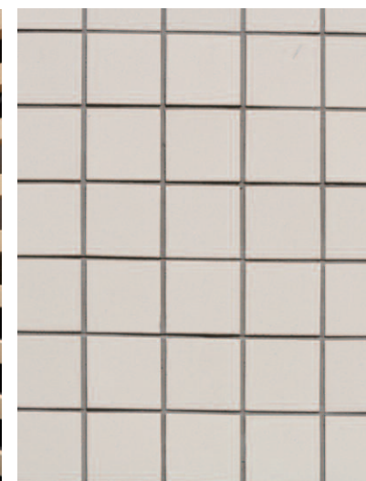
タイルディテールアップ