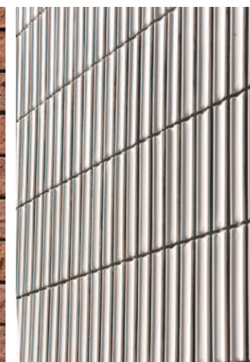
タイルディテールアップ