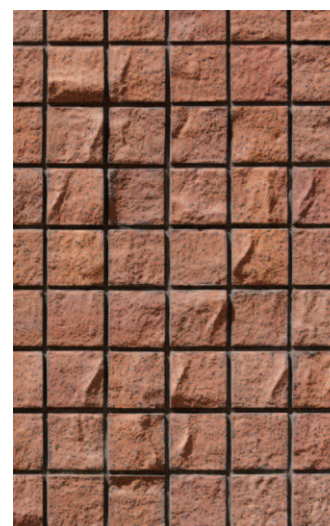
タイルディテールアップ