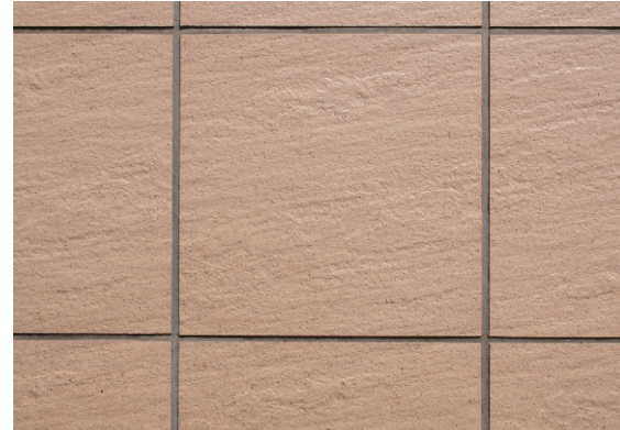
300角タイルディテールアップ