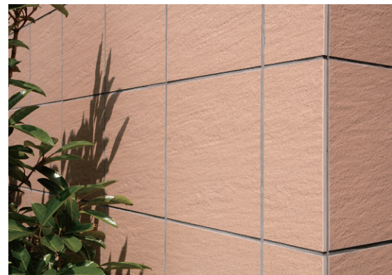
300角タイル コーナー部ディテール