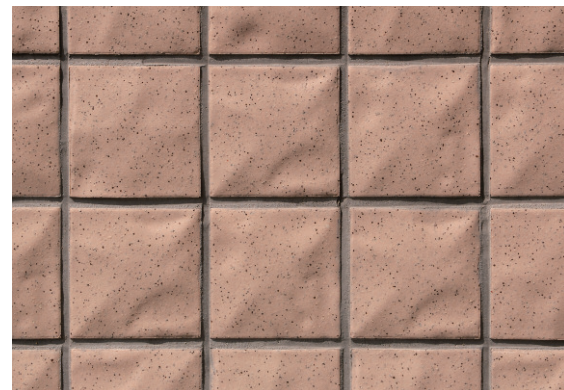
100角タイルディテールアップ