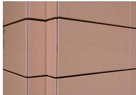
900×300タイルディテールアップ