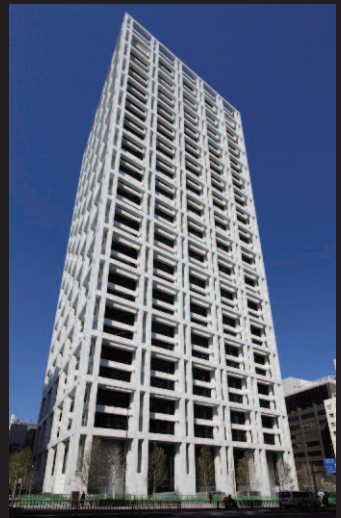
c.石黒写真研究所 外観

超高層階からの眺めの良いビューバスタイプが採用。 開放感ある浴室を配慮し、テンパードアをH=2400とした特注品です。 トイレは高級感のある"レジオ"やデザイン性の高い"サティス"を使用しています。