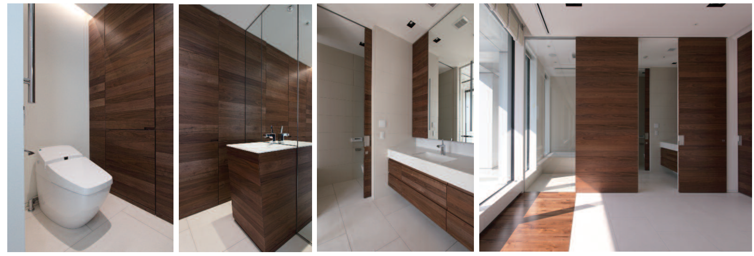
トイレ・手洗(ゲスト用)