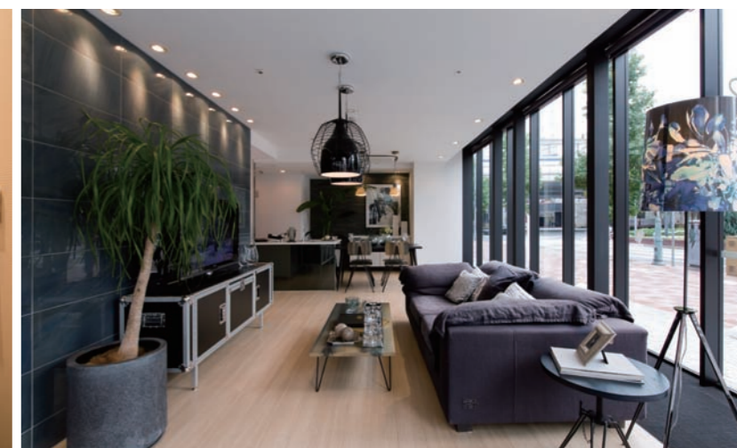
リビングダイニングキッチン