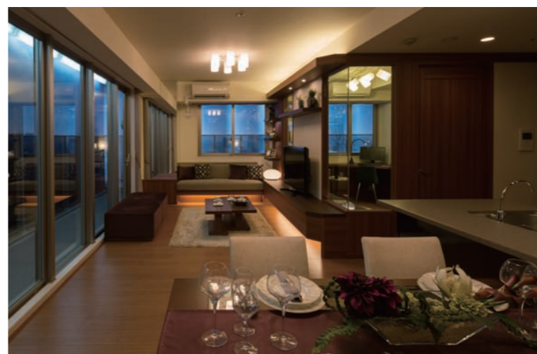
リビングダイニングキッチン