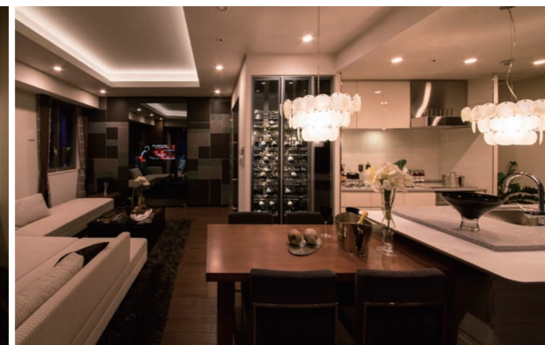
リビングダイニングキッチン