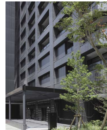
南側/エントランス部中景