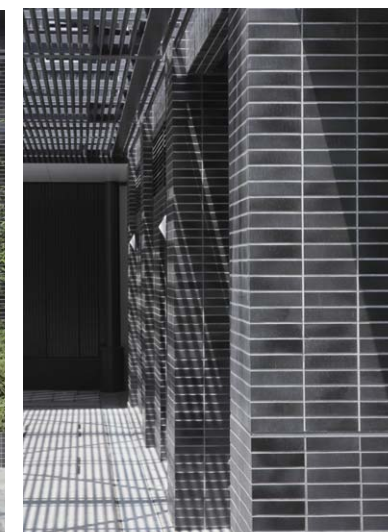
東側コーナーディテール