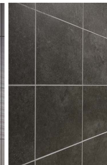
エントランスホール内壁