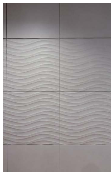
エントランス内壁ディテール