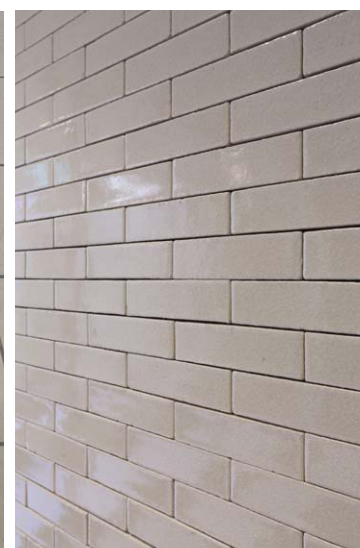
エントランスニッチ壁