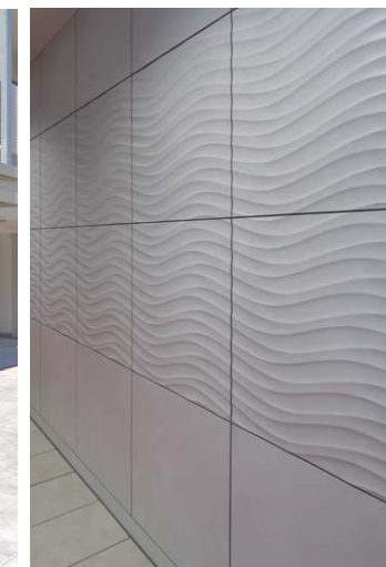
エントランス内壁