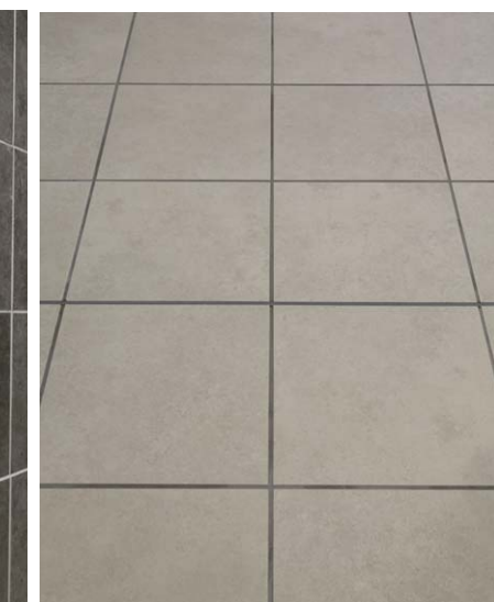
エントランス内床