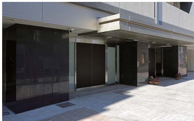
エントランス外観