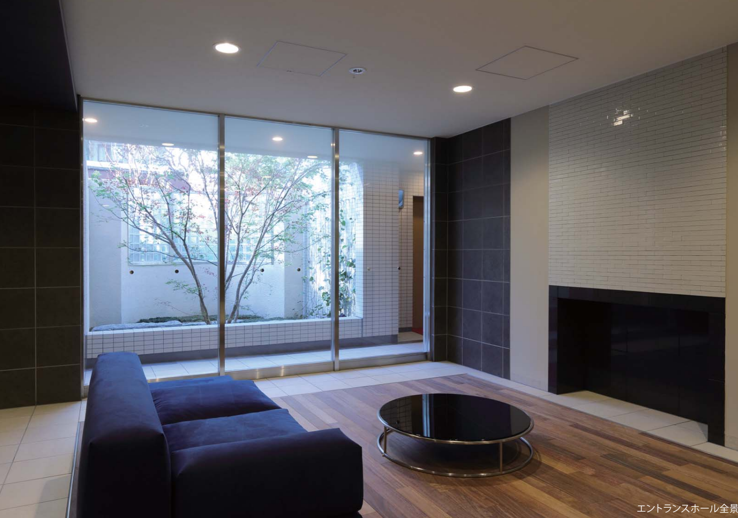
エントランスホール全景