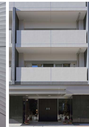
エントランスまわり外観