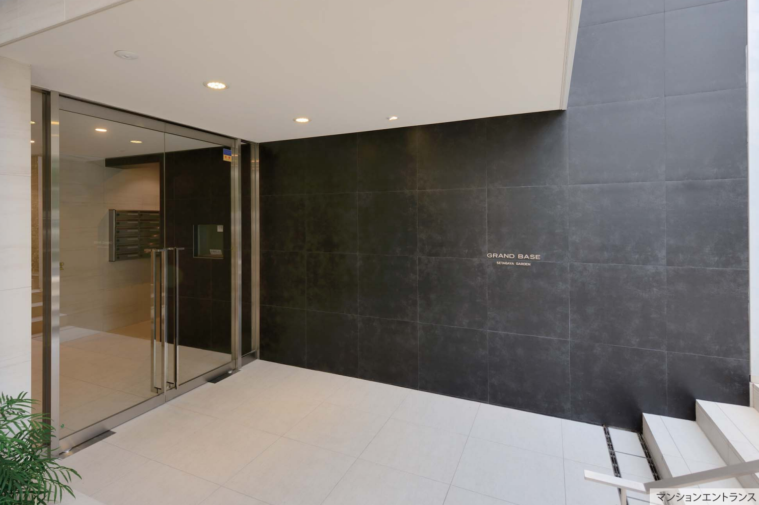
マンションエントランス