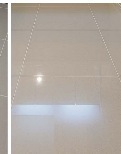
洗面所内装床ディテール