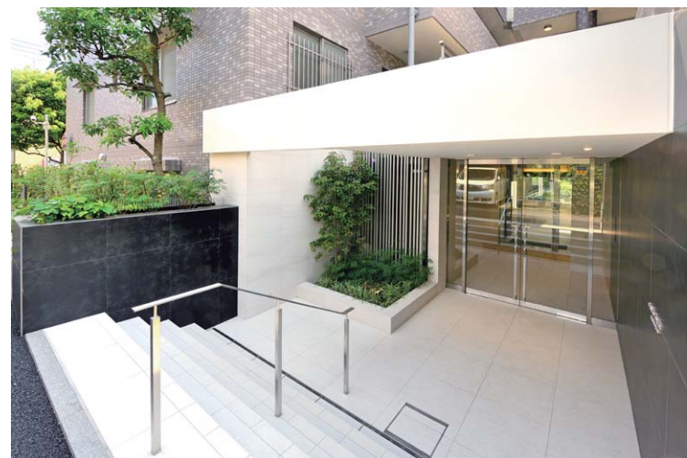
マンションエントランス