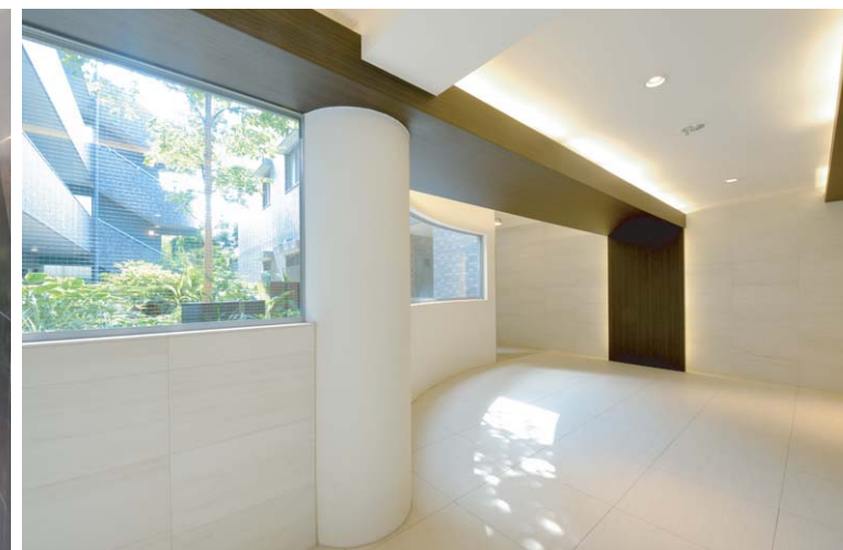
共用廊下・エレベーターホール