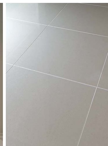
エントランス外装床タイルディテール