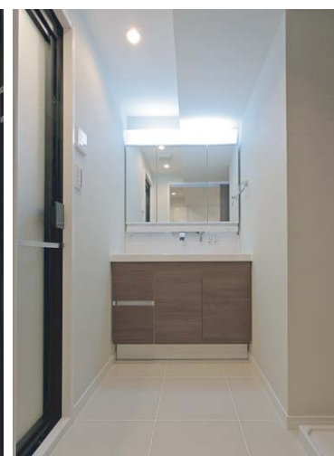
洗面所内装床タイル