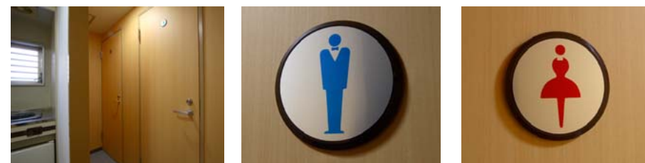
男子トイレサイン