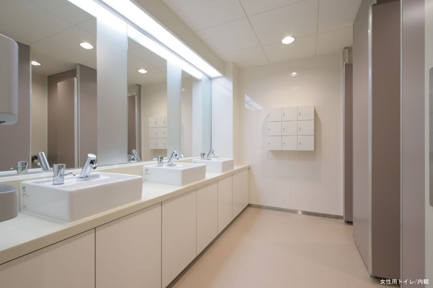
女性用トイレ/内観