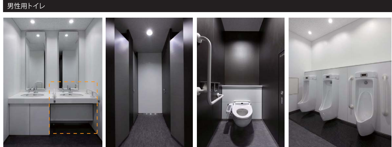
男女ともに大便ブースの1カ所に手すりを設置、扉を外開きにして車椅子利用者にも使用可能にした。同様に、洗面カウンターも1カ所をカウンター下まで車椅子で入れる形に。小便器も1カ所に手すりを設けるなど、様々な利用者に配慮した。