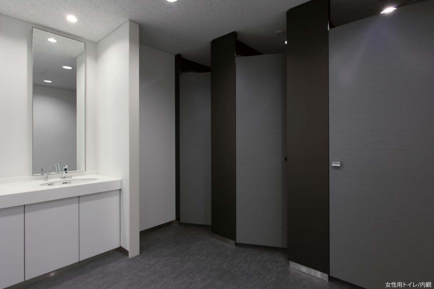
女性用トイレ/内観