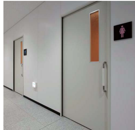
左が男性用トイレ、右が女性用トイレの各出入口。