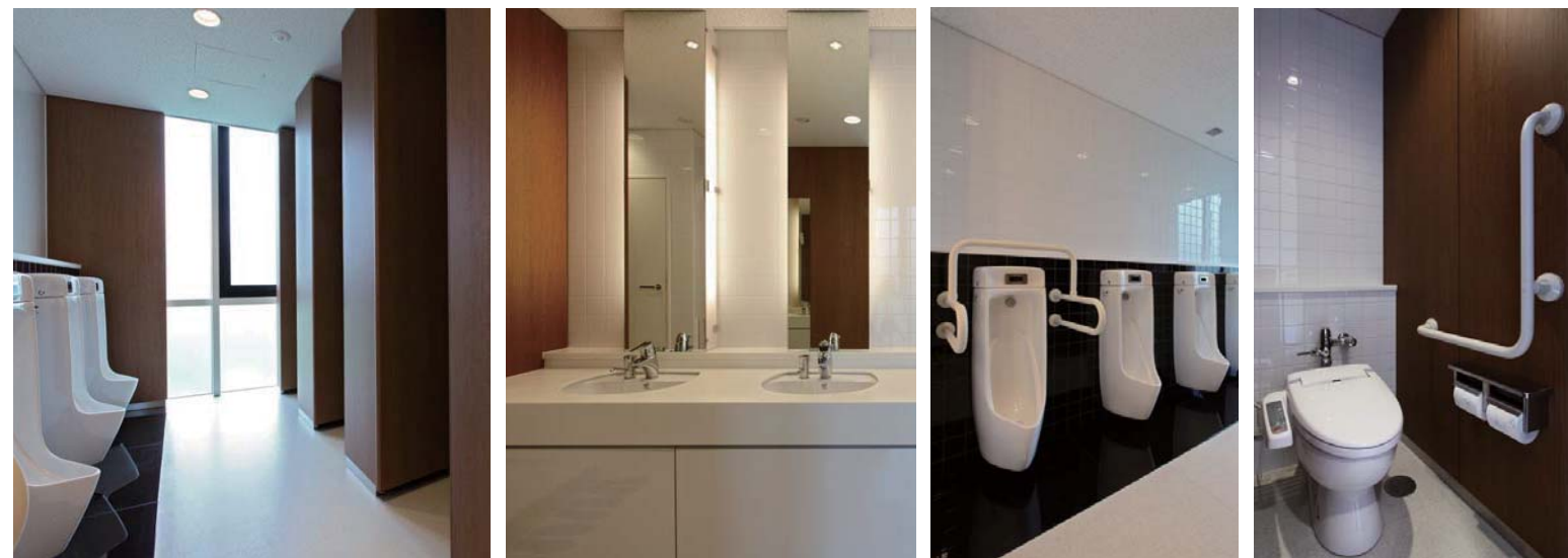
最奥部に設けた窓から外光が入り、明るく開放的なトイレ空間となっている。節水性の高いセンサー一体形の壁掛けストール小便器を採用するなど節水面でも省エネルギーの配慮がされている。