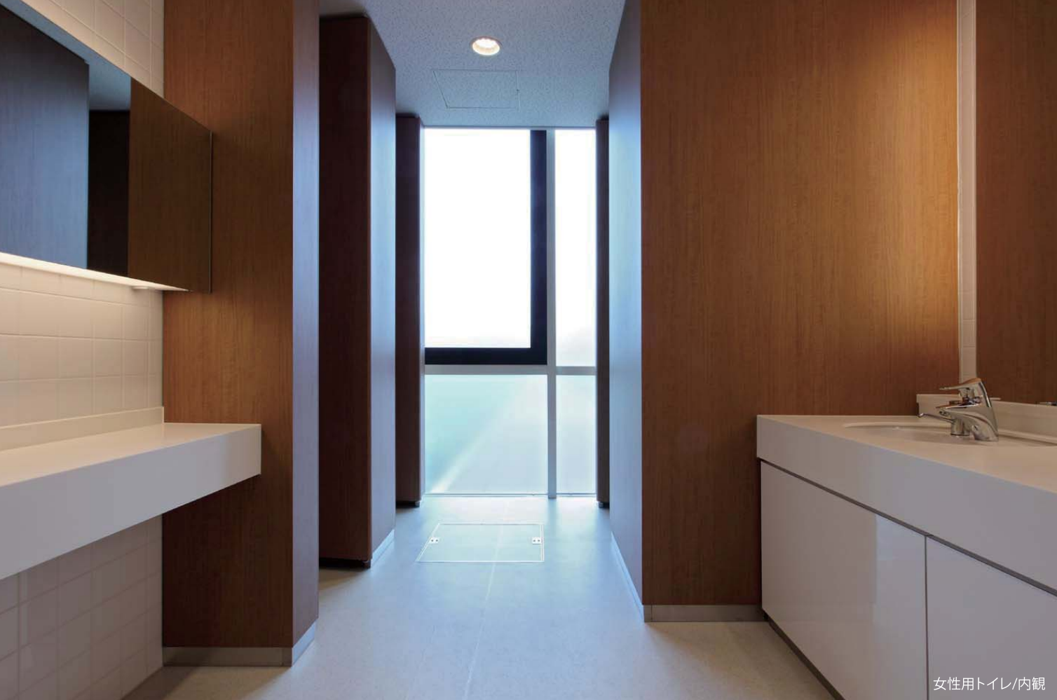
女性用トイレ/内観