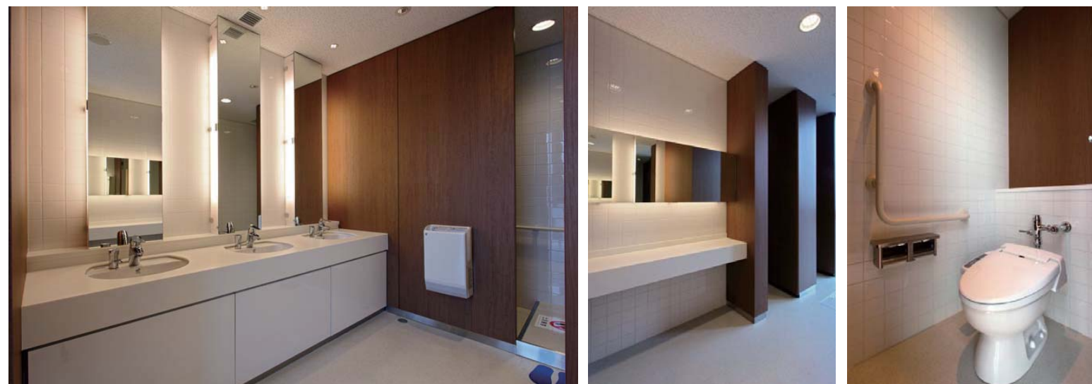
女性用トイレは洗面カウンターの向かいに、簡単な化粧直しに適したスタンディングタイプのパウダーコーナーを設置し、女性オフィスワーカーの利用に配慮している。また、女性用トイレのシャワートイレは擬音装置付のものを採用。音消しのための洗浄回数を減らすことでも節水につながっている。