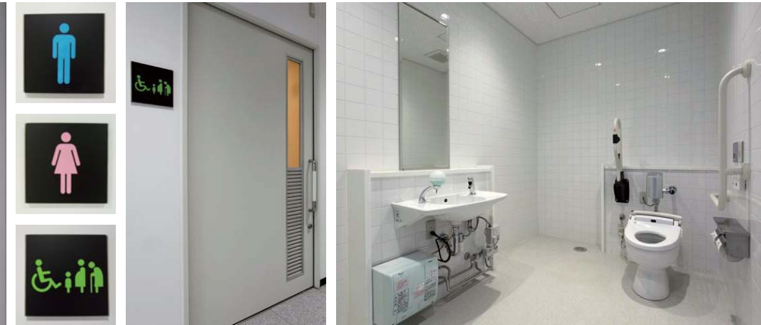
来客時にも使用する1階には多目的トイレを設置。広々としたスペースを確保。