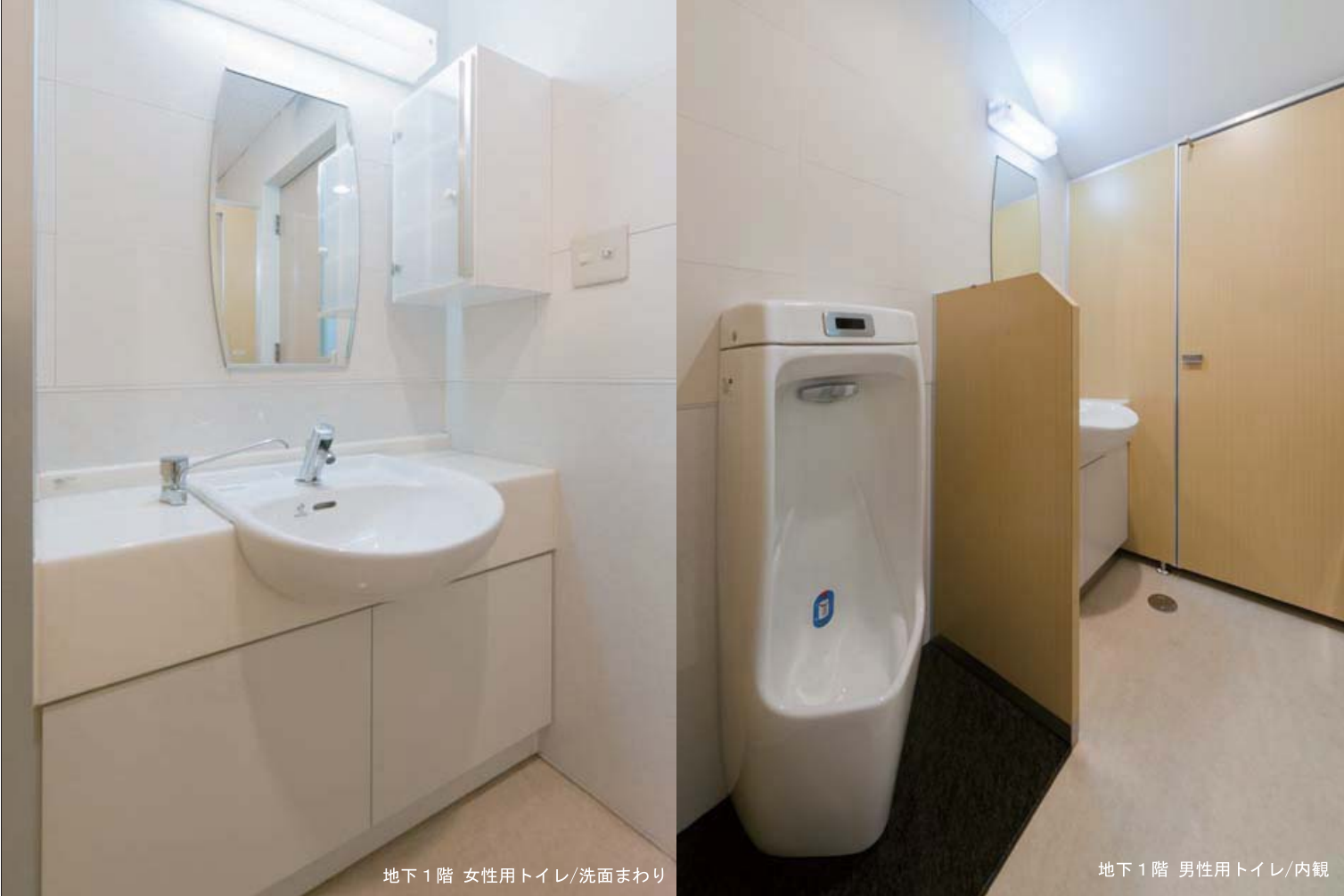
地下1階 女性用トイレ/洗面まわり