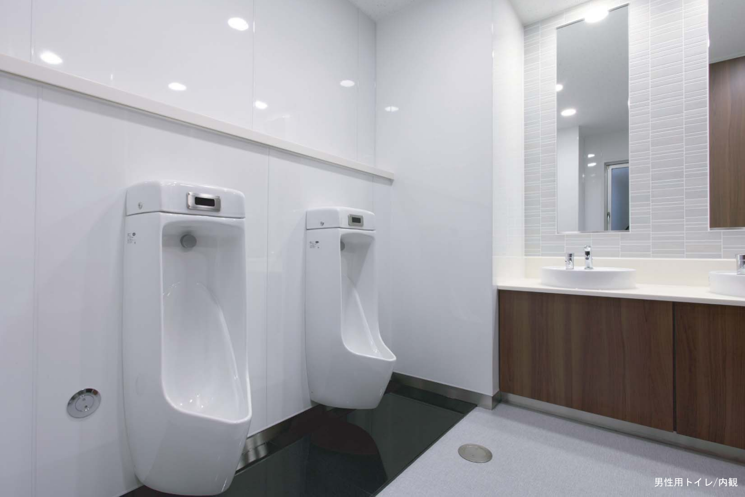
男性用トイレ/内観