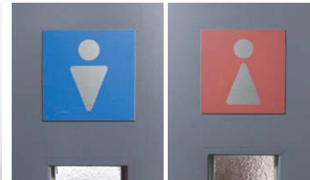
▲トイレサイン ◀トイレ入り口まわり