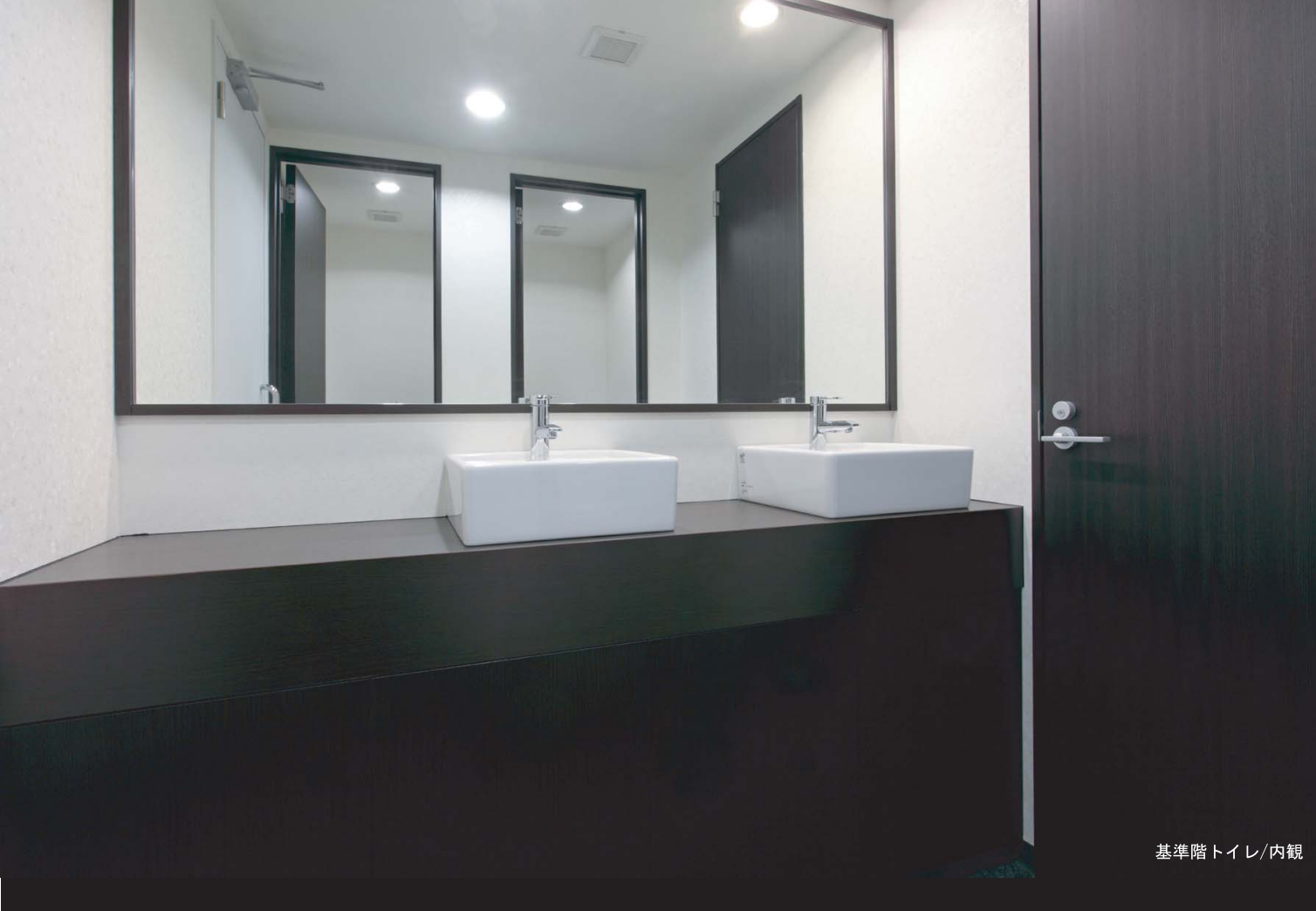
基準階トイレ/内観