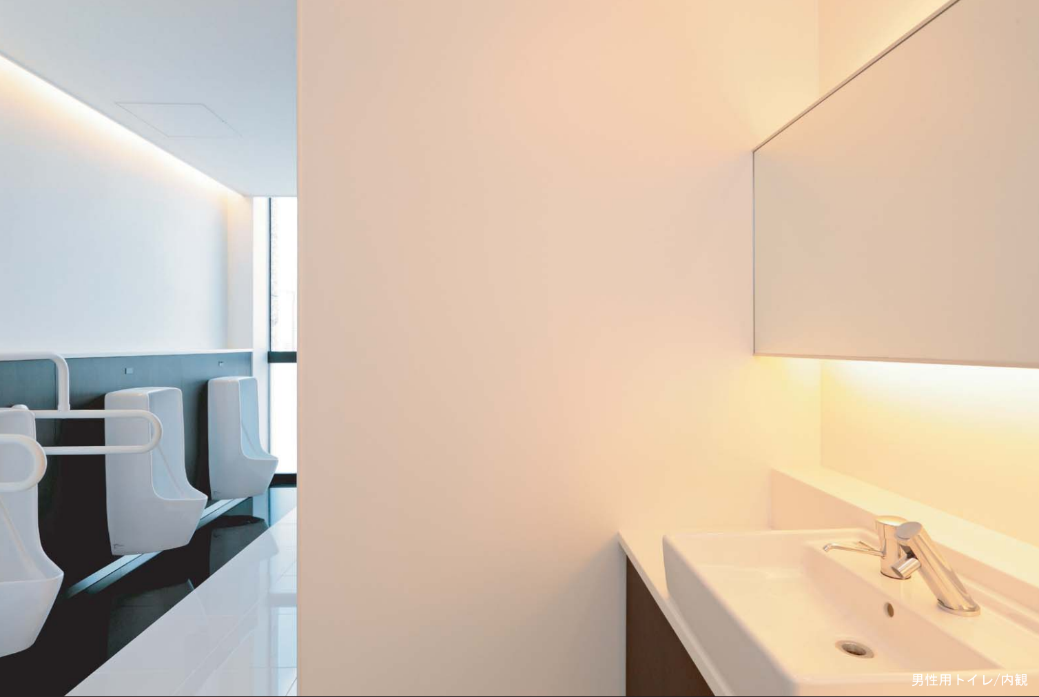
男性用トイレ/内観