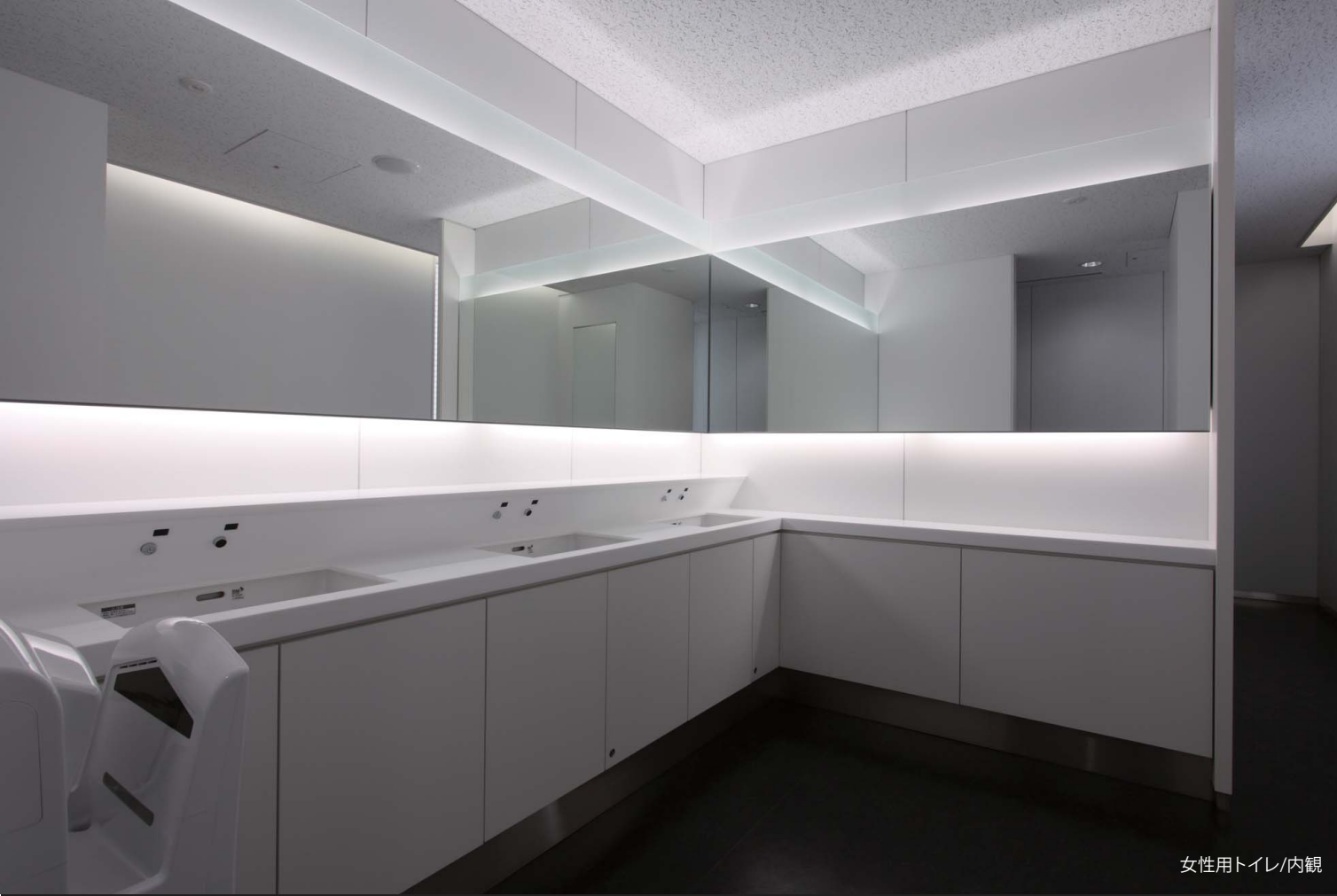
女性用トイレ/内観