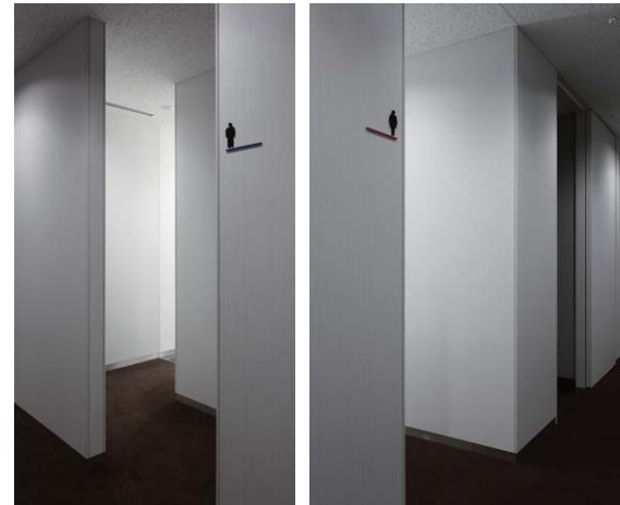
男性トイレ入り口