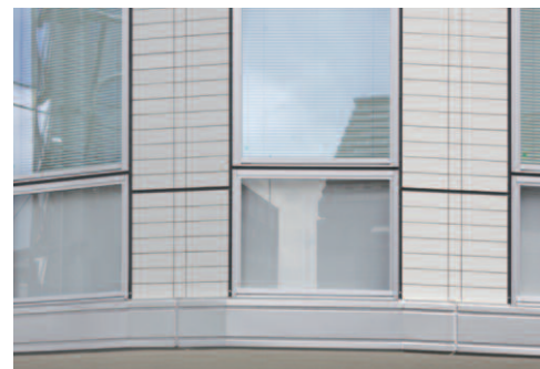
タイルディテール(開口部)