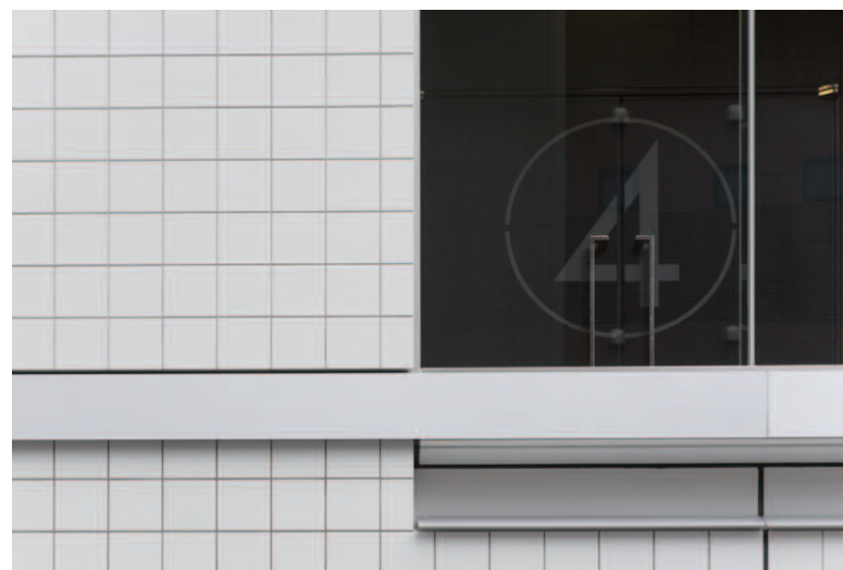
タイルディテール