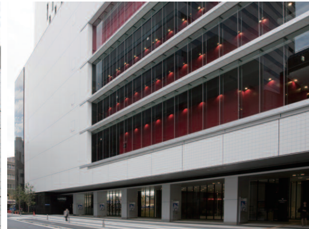
北側/見上げ(縦位置)