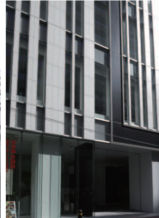
南西側／中景(低層部)