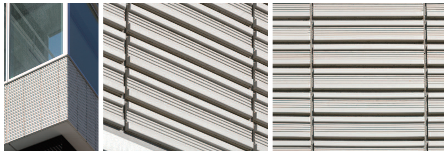
コーナー部タイルディテール