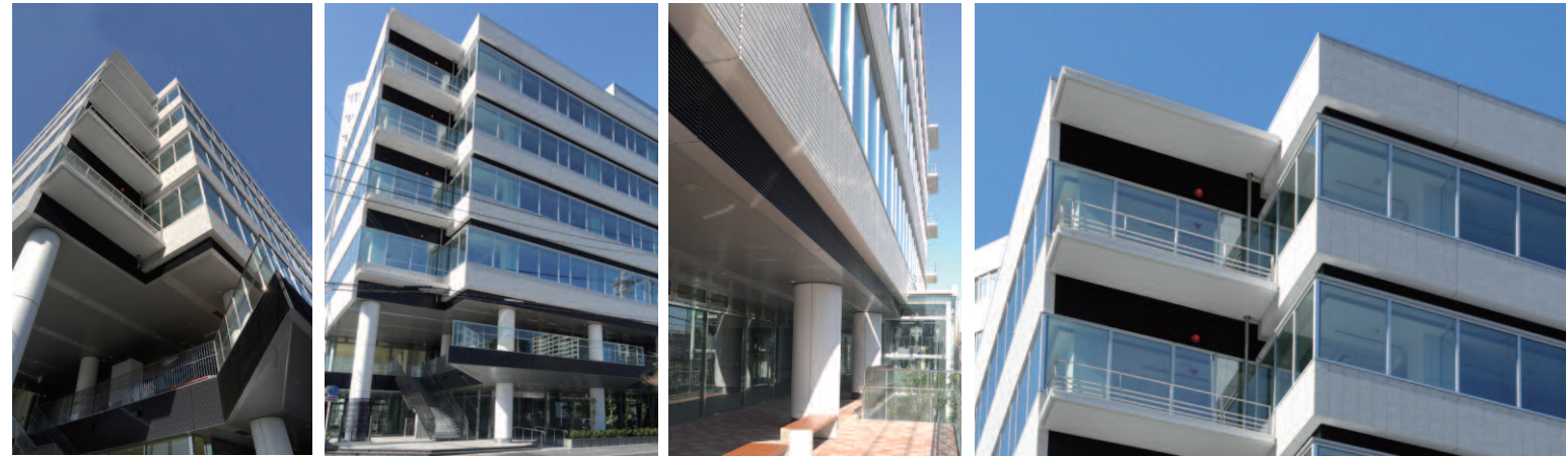
北東側/コーナー部(見上げ)