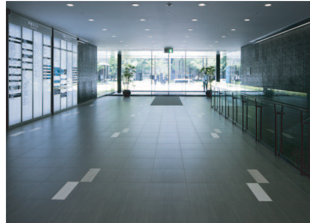
西側/エントランスホール