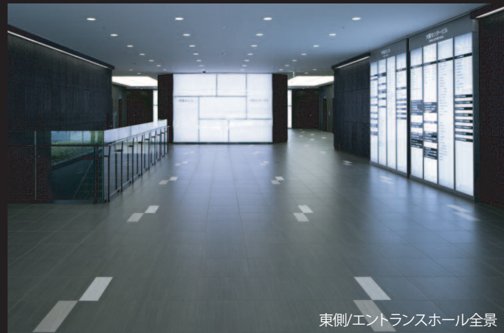
東側/エントランスホール全景

木とシルクの風合いを併せ持った床タイルで屋内外の空間を繋ぎ、オフィスエントランスを演出。歩行者を白いアクセントデザインでエントランス内外に誘導させます。モダンながらも温かみのある床を演出したタイルは、床面に広がりをもたせ、空間に美しさとゆとりを感じさせます。屋内外の床面の繋がりと一体感を持った美しい建築空間となりました。