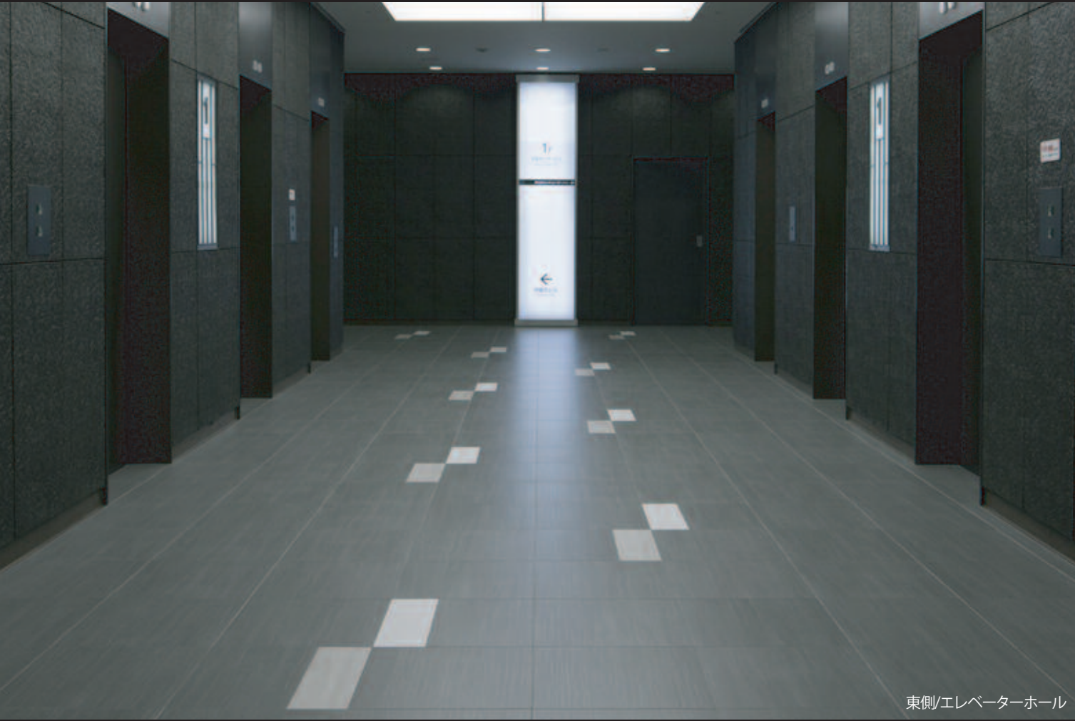
東側/エレベーターホール