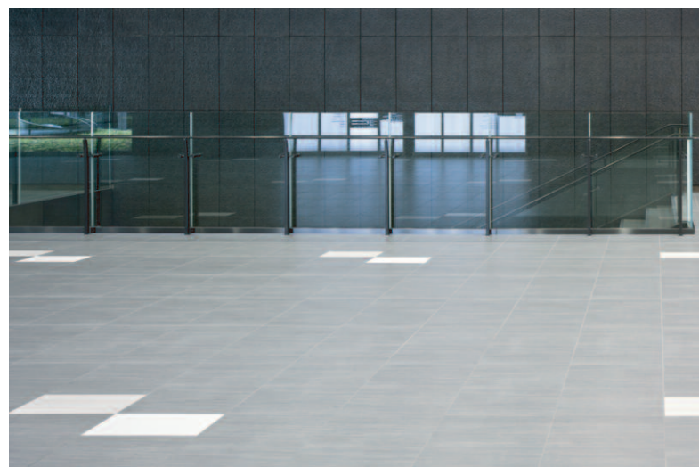
タイルディテール