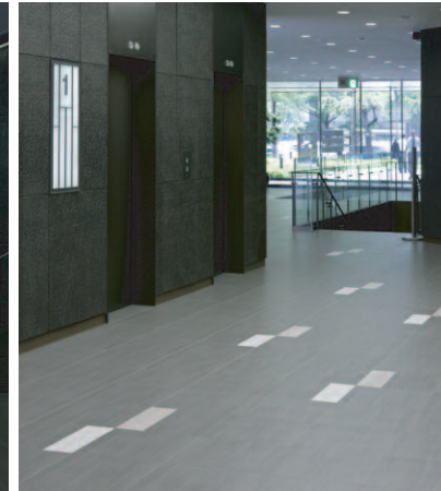
南西側/エレベーター前