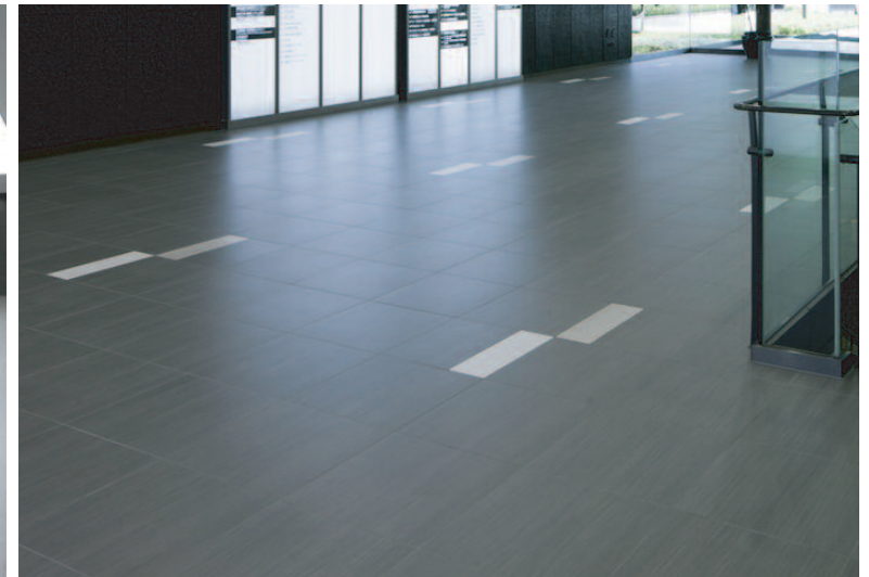
南西側/エントランスホール