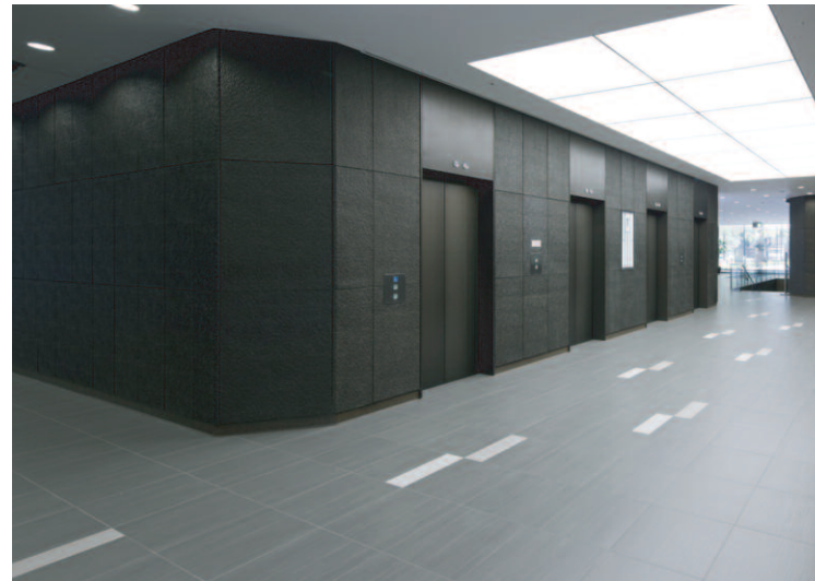
南西側/エレベーター前