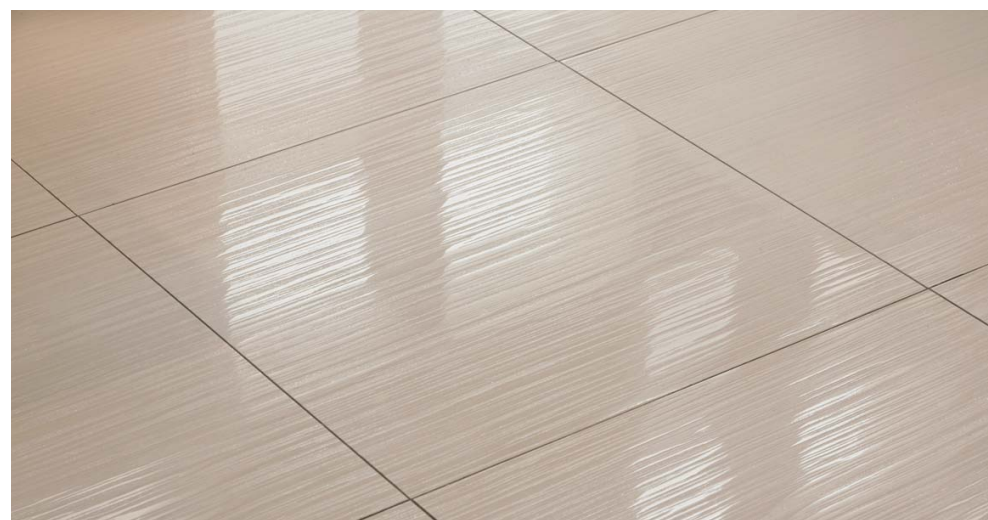
タイルディテール (エントランス・ラウンジスペース)