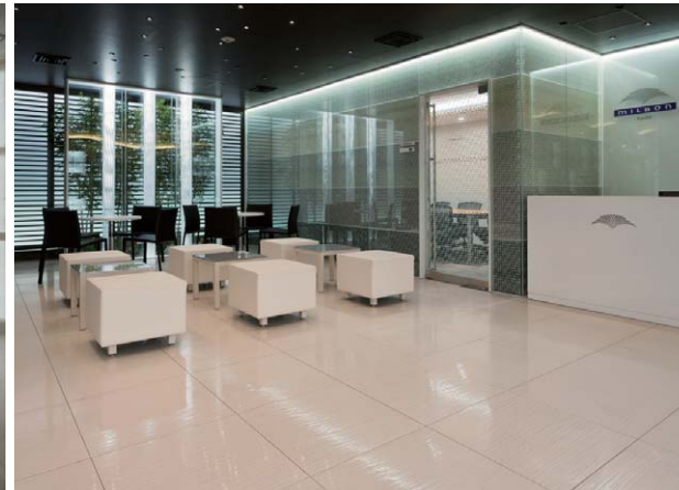
ラウンジスペースと受付 (奥の照明は『ツヤのある髪』をイメージしている)