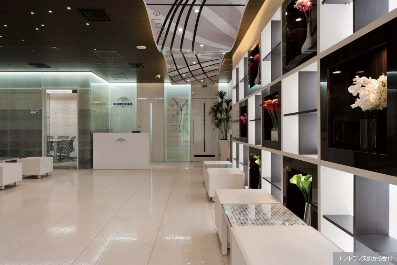
エントランス側から受付