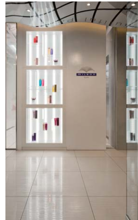
エレベーター正面ディスプレイ