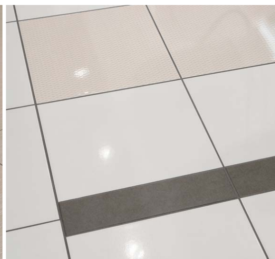
タイルディテール (スタジオ・ラボ-1)