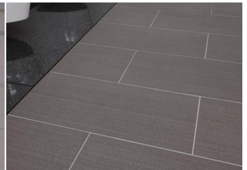
タイルディテール