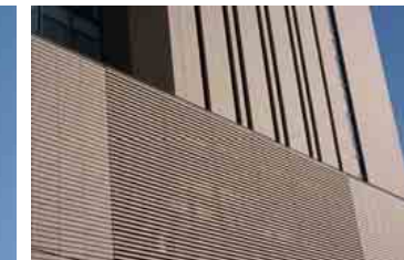
西面外壁とルーバー