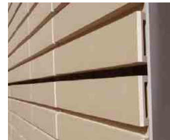
テラコッタ施工断面詳細