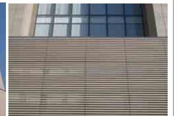
ルーバーのディテール