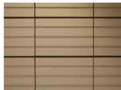
テラコッタディテール