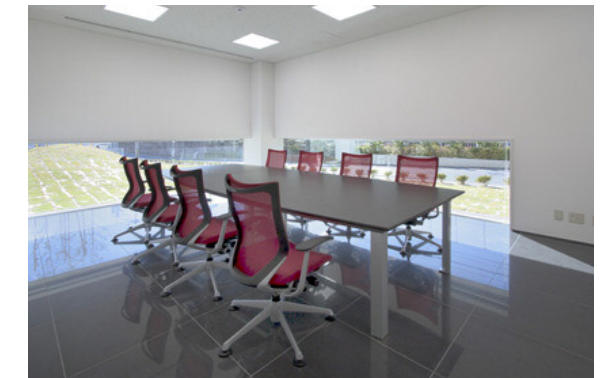
1階会議室：エコカラットとキングポリス