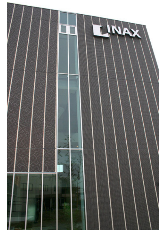
西側からの見上げ全景：ライトスクラッチと細割ボード