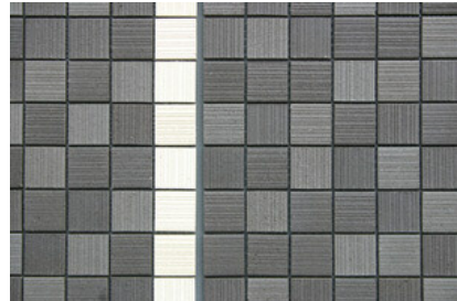
ライトスクラッチ デテールアップ