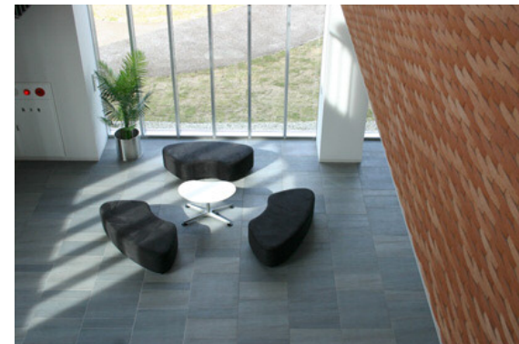
2階からエントランスを見下ろす：ストーンエッジとカイハ