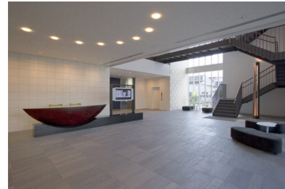
1階エントランス：玄関側から見る