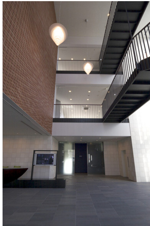
1階からのエントランス見上げ全景