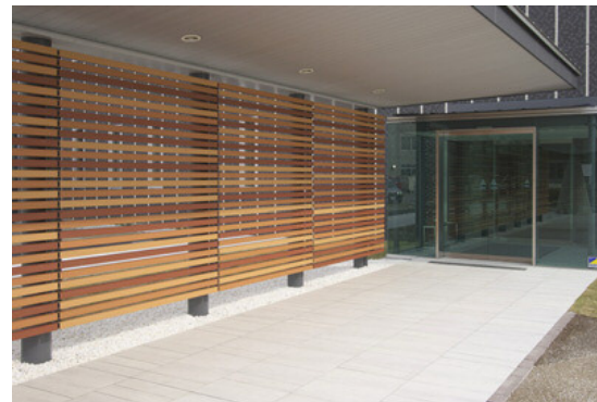
西側キャノピー壁とアプローチ床