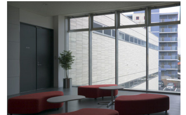
2階のリフレッシュコーナー部壁：アガトスフロストリップ