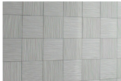
アガトス竹籤 デテールアップ