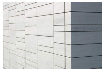
ストーンエッジ デテールアップ