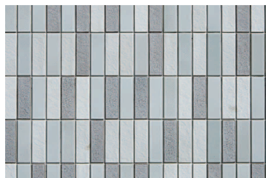
タイルディテール