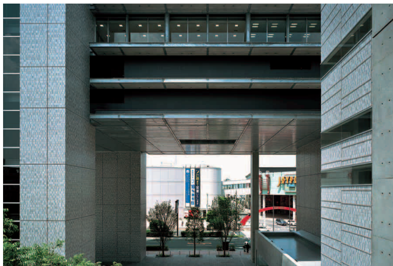
低層部を見下ろす