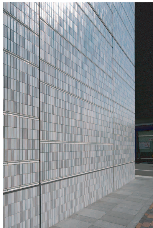
ディテールアップ