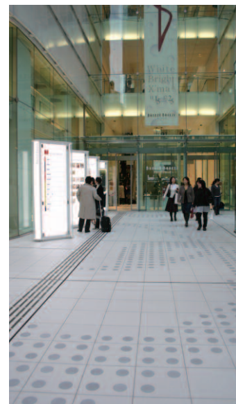
北側エントランス入口