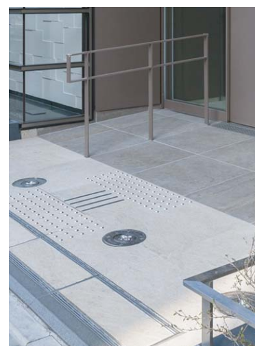
エントランスアプローチ外装床