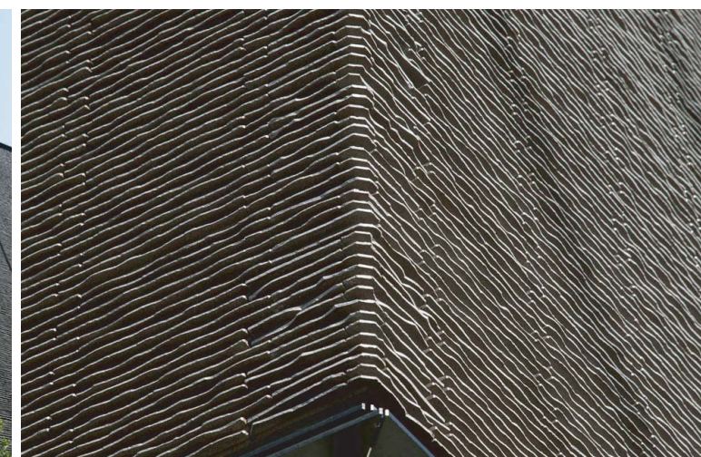
外装壁コーナー部