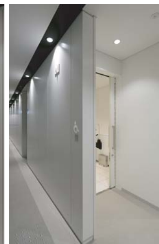
多目的トイレ入り口