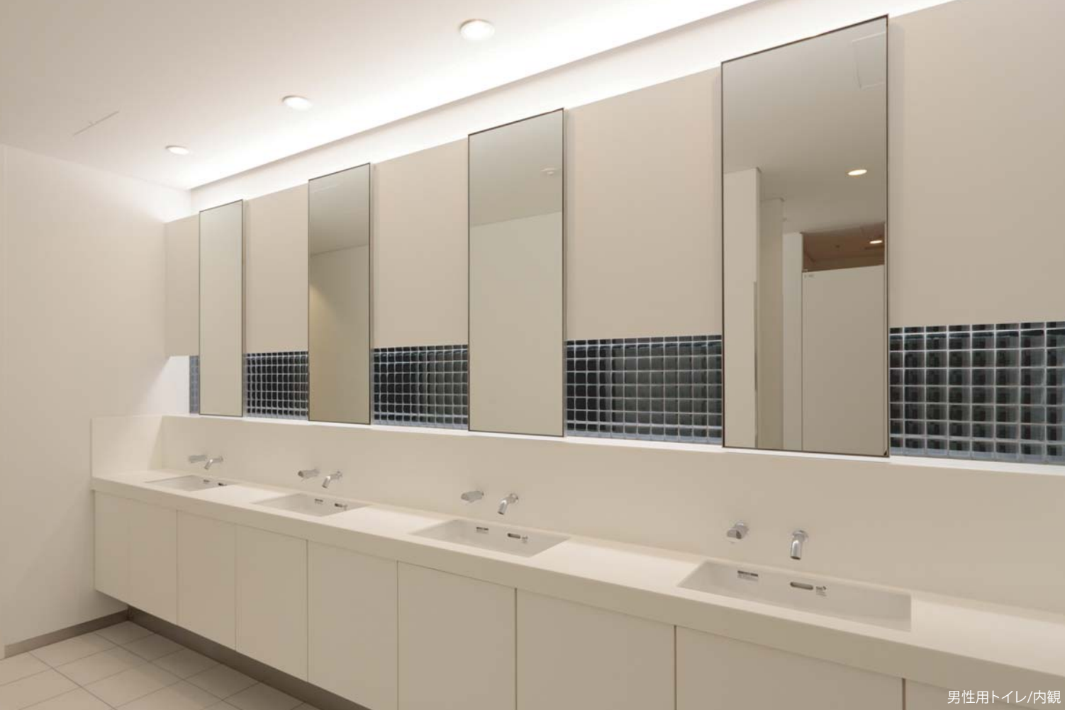
男性用トイレ/内観