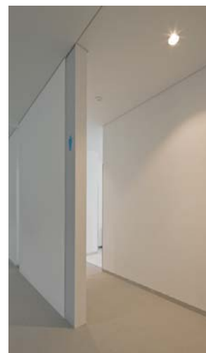
男性用トイレ入り口