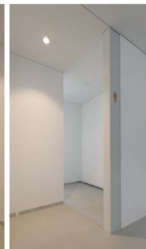
女性用トイレ入り口