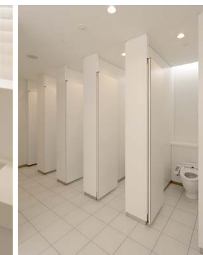
手洗いコーナーとパウダーコーナーがL字に配置された女性用トイレ。水栓はカウンターまわりが汚れにくく、水の止め忘れも防げる衛生的で経済的な自動水栓を採用。個室間の仕切りは天井まで立ち上げられており、利用者同士のプライバシーに配慮。また、横ラインの間接照明やアクセントのパール調タイルも空間に広さと明るさを演出している。