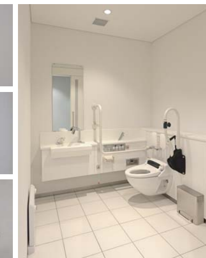
コンパクトながらも使い勝手に配慮。チェーンジグボードも設置された。