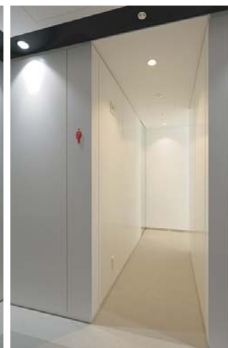
女性用トイレ入り口