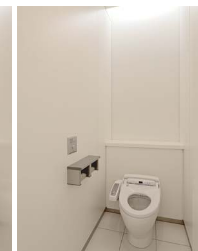
スーパーAI節水機能を備えたセンサー式自動洗浄壁掛式小便器と、超節水ECO6のパブリック向け大便器で、大幅節水に貢献するオフィスに。小便器は壁掛式のため便器下の汚れやすい床面を簡単に掃除することができ、オフィストイレに望まれる清潔な空間を維持しやすくなっている。壁面に使用されたアクセントタイルの光沢も清潔感の演出に貢献。