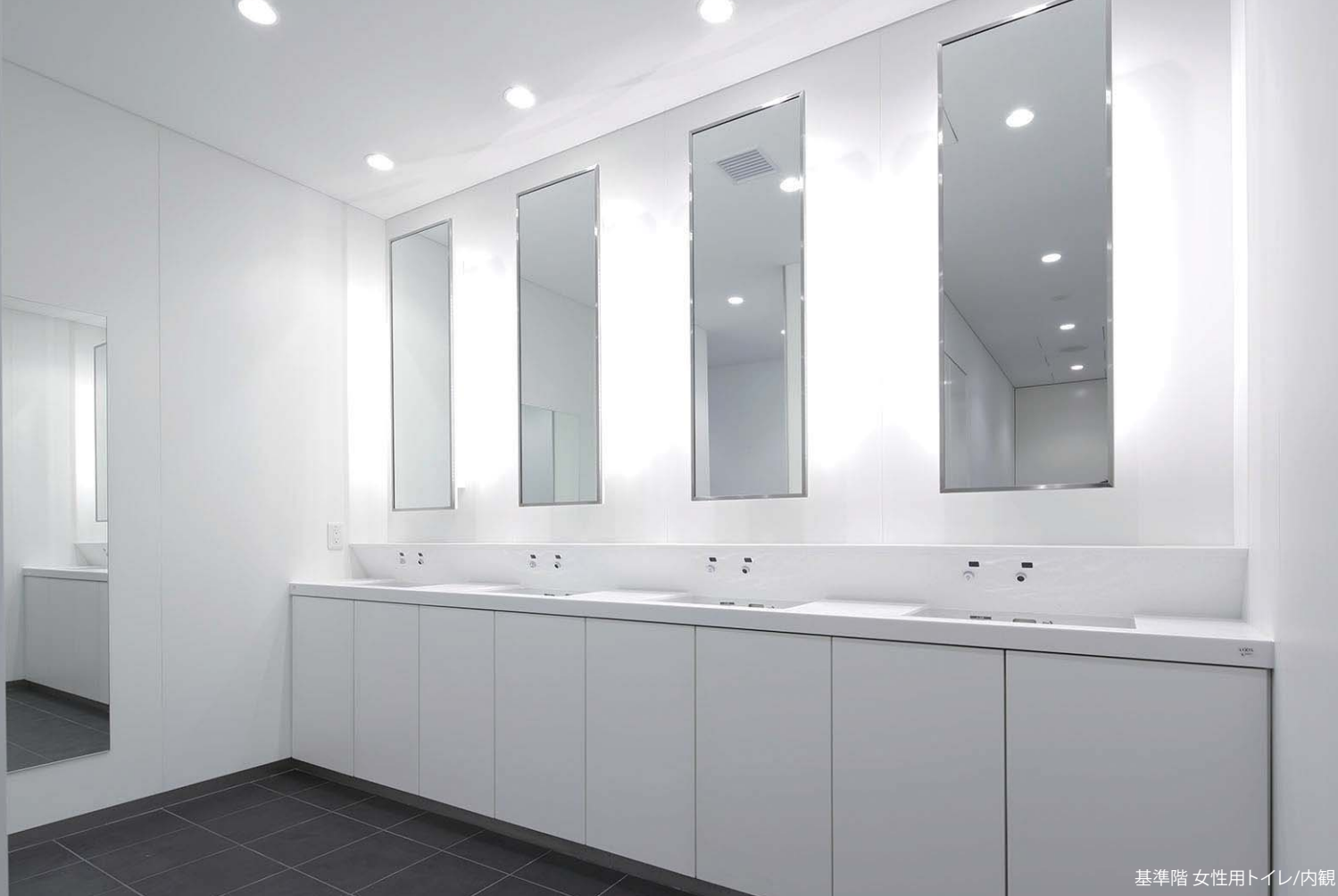
基準階 女性用トイレ/内観