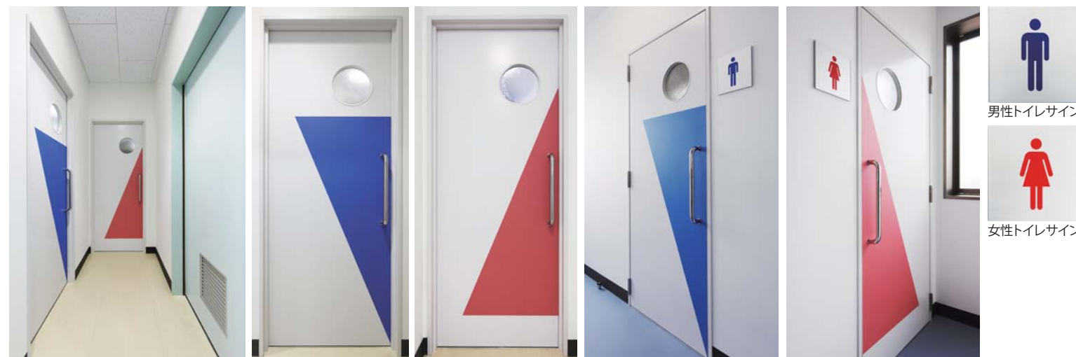
1階トイレ入り口まわり