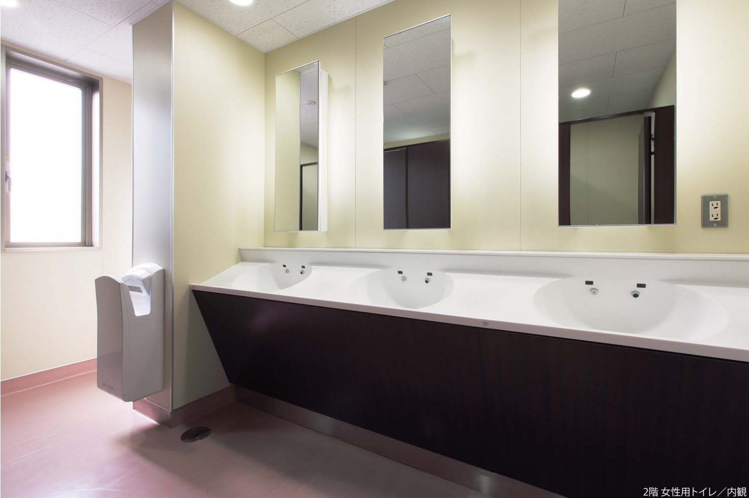
2階 女性用トイレ／内観