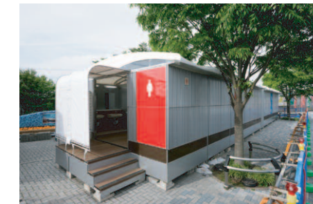
女性用トイレ入り口