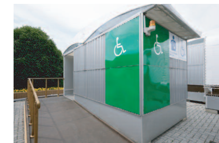
多目的トイレ入り口