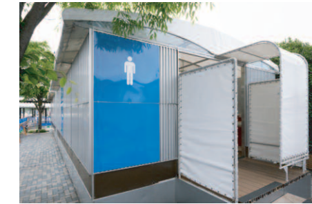
男性用トイレ入り口