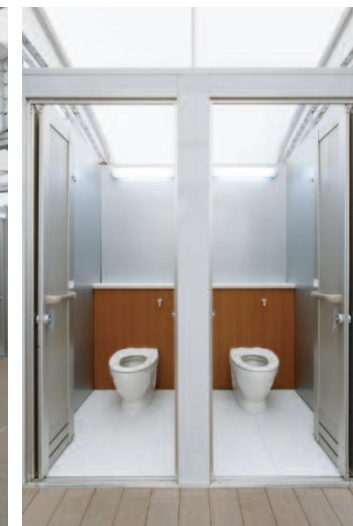
大便器ブースまわり