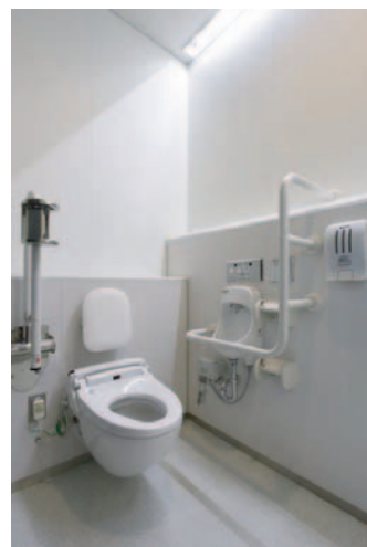
大便器ブースはすべてに、洗面器と小便器は各1か所に手すりを設ける、ブース内や通路等のスペースを広く取るなど、身障者・車いすでの利用に配慮している。また、大便器ブース内にはベビーシート・ベビーキープを設置し、男性の子連れ利用にも配慮している。