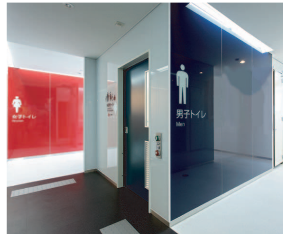
3階男女多目的トイレ入り口まわり