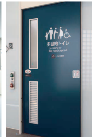
4階多目的トイレ入り口