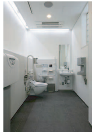
4階の多目的トイレには、オストメイトにも対応できる洗浄水栓を設置している。