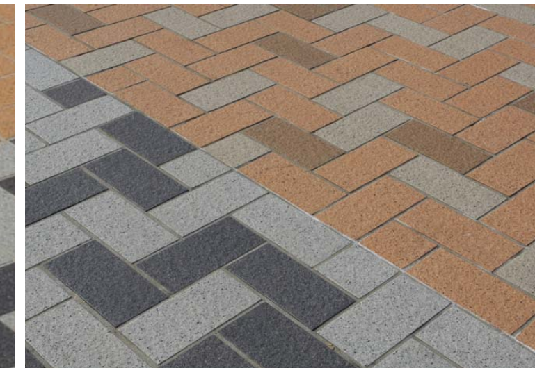
タイルディテールアップ