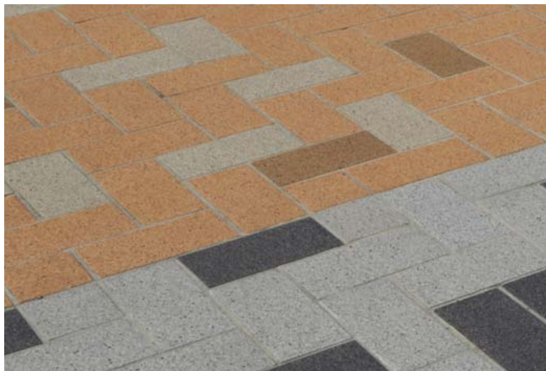
タイルディテールアップ