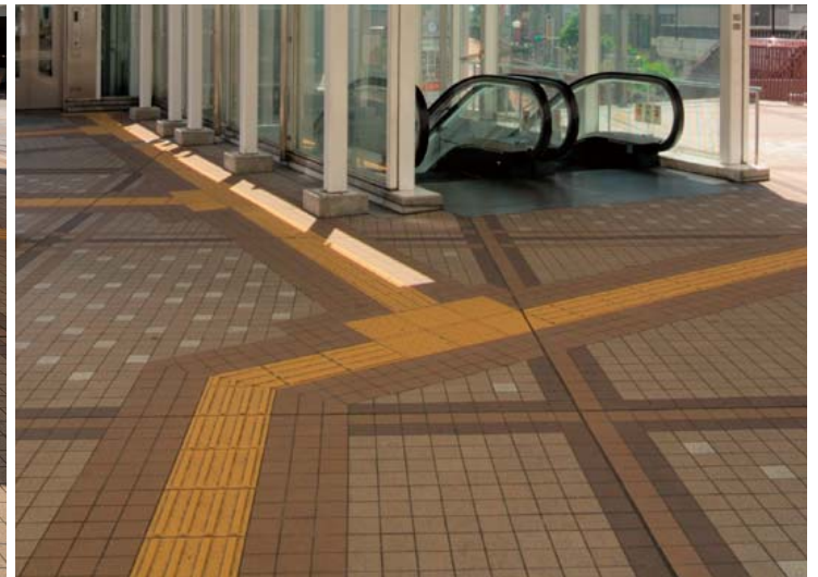
エスカレーター側