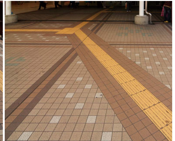
視覚障害者用タイルにコントラストを付ける