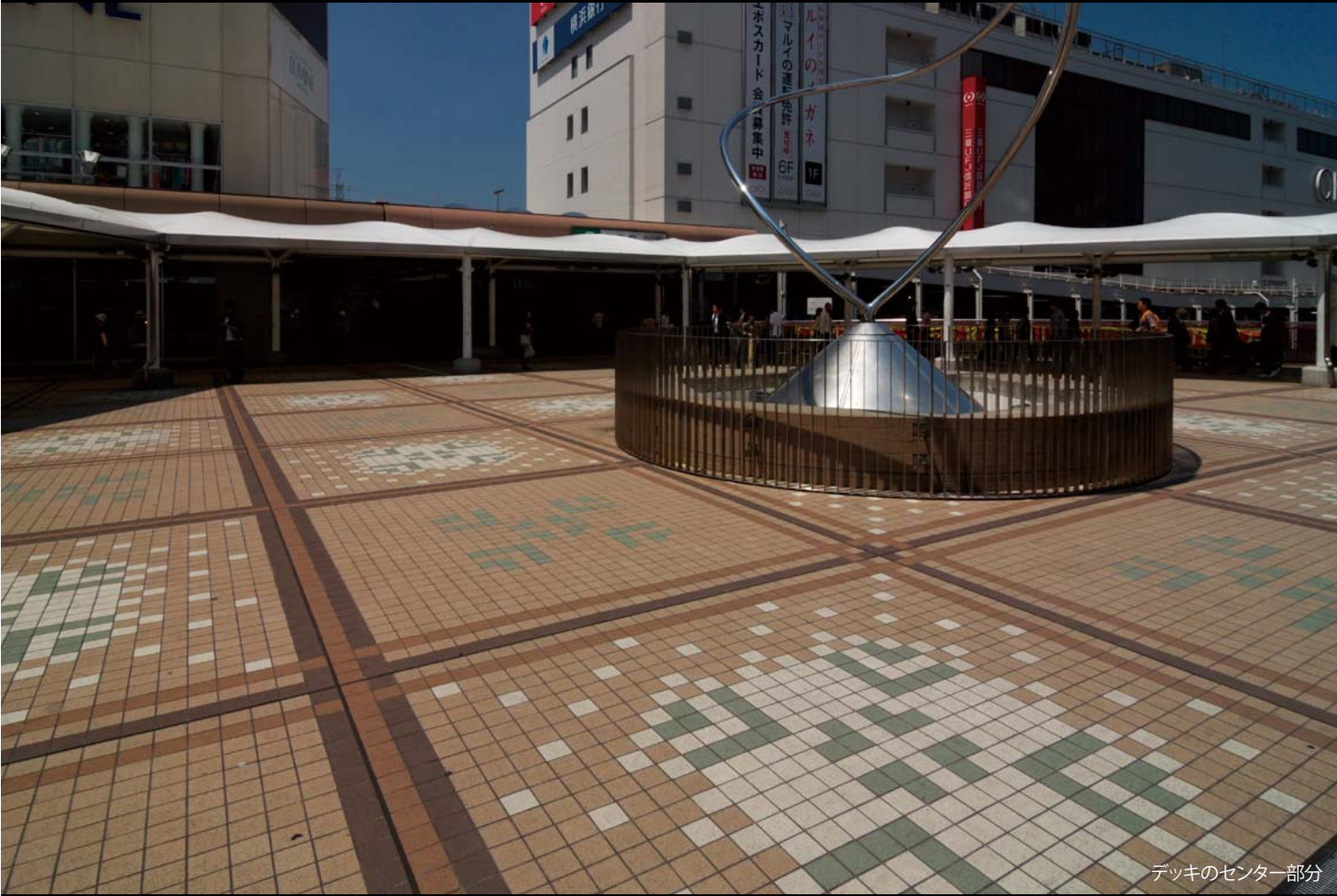
デッキのセンター部分