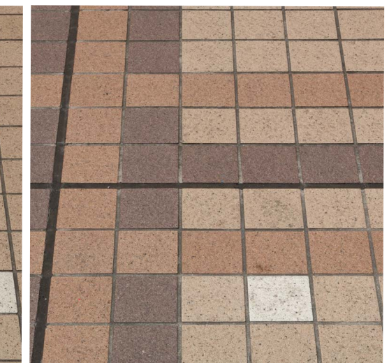
タイルディテールアップ