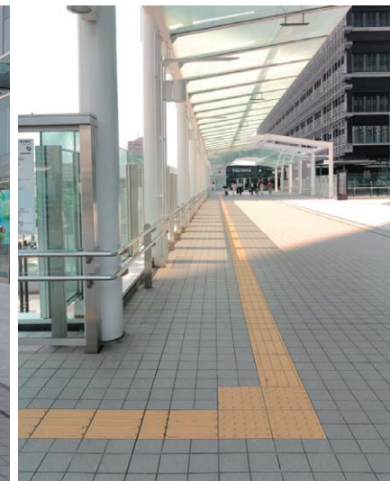
デッキコーナー部