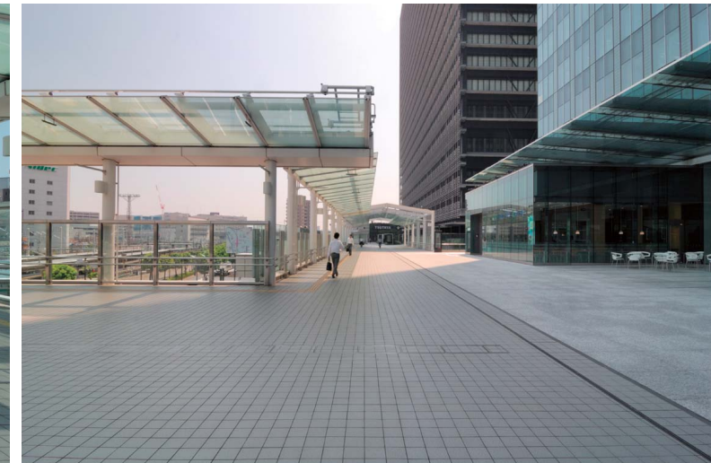
ビル外構との接続部