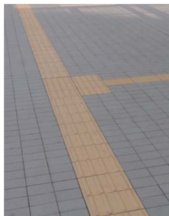
タイルディテールアップ