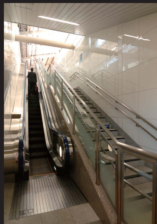
改札側階段及びエスカレーター

階段部の改修工事として内壁には大形建材アガトスを採用しました。採光を取り入れ、その反射を生かして階段室全体を明るい壁面に仕上げています。光沢のある厚釉を施すことにより、壁面に釉薬の深みやガラス層を効果的に表現しています。またリブ状のレリーフを一定のピッチで入れ込み、変化を付け、階段のスケール感を表現しています。また定期的なメンテナンスを配慮し、表面が平滑で光沢のある大形タイルを使用する事で壁面の清掃も楽になります。