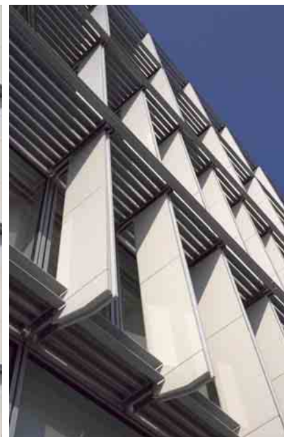
南西側ルーバーディテール見上げ