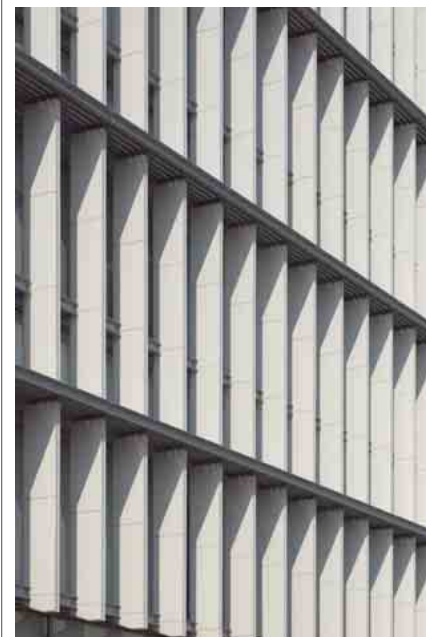
南西側ルーバーディテール