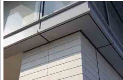
南東側コーナータイル納まり