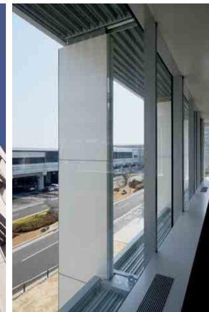
室内よりセラミックルーバーを見る