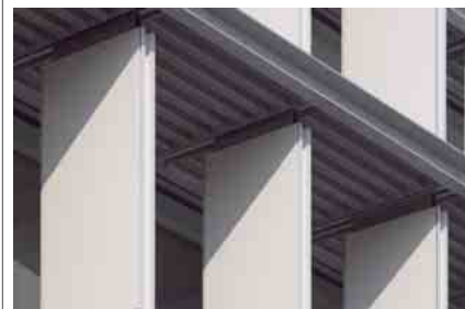
セラミックルーバー取付部ディテールアップ